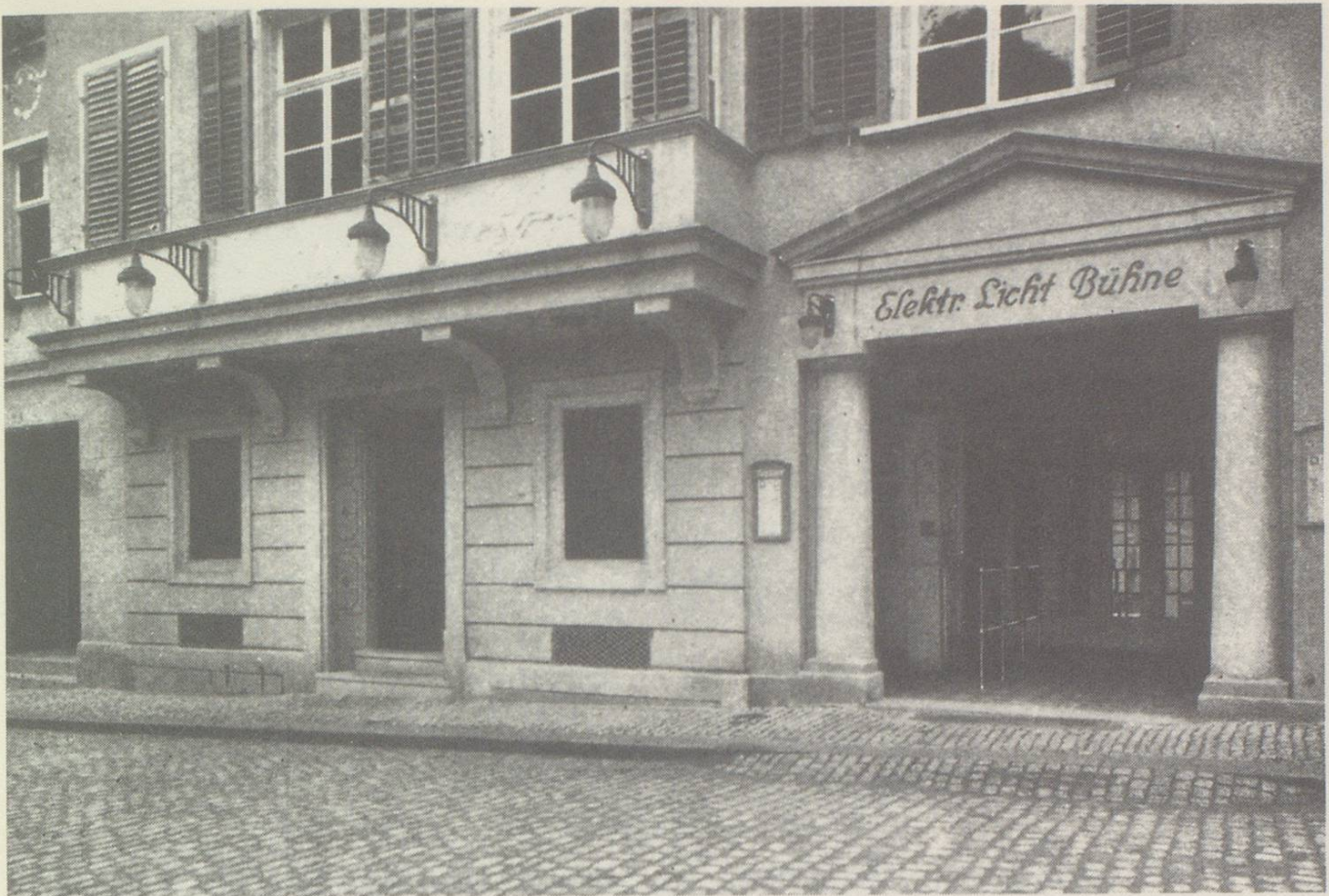
Eingang zur «Elektrischen Lichtbühne» an der Magnihalde, 1912 (Schreibmappe 1912 der Buchdruckerei Zollikofer).