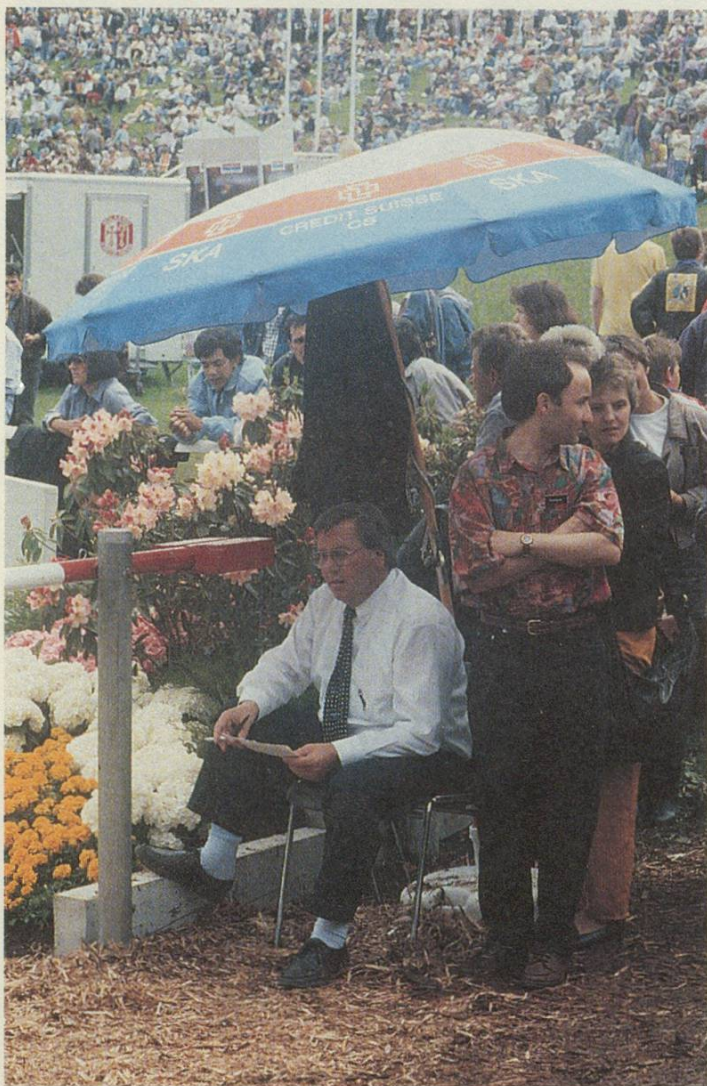
Mangelware waren Schattenplätze