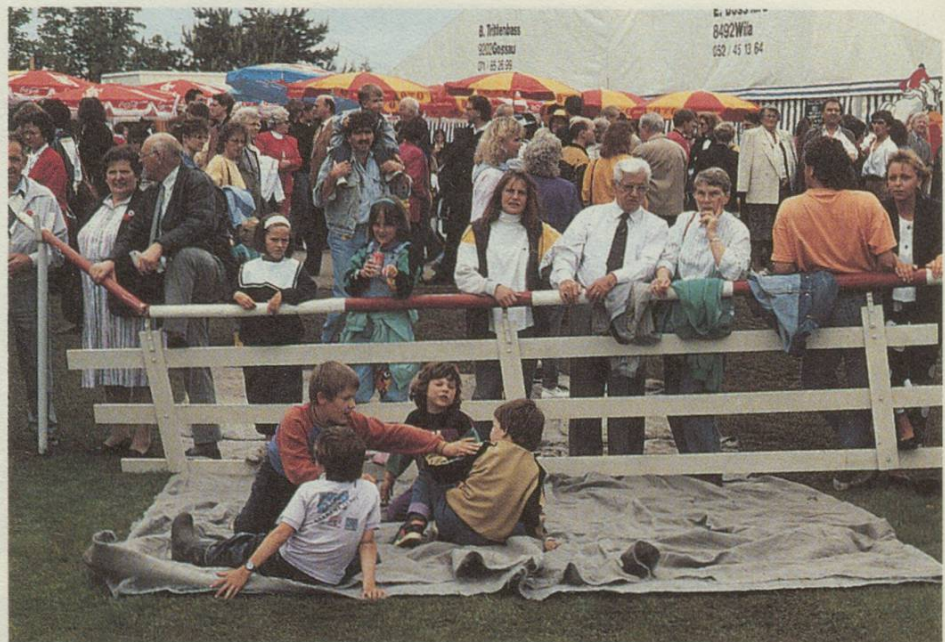
Kinder unterhielten sich auf ihre Art