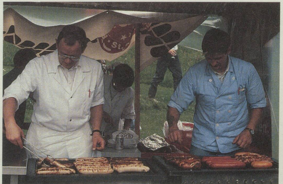
St.Galler Bratwürste waren stets gefragt