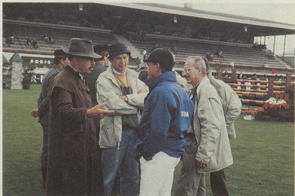
Lagebesprechung zwischen Aktiven und Parcoursbauer