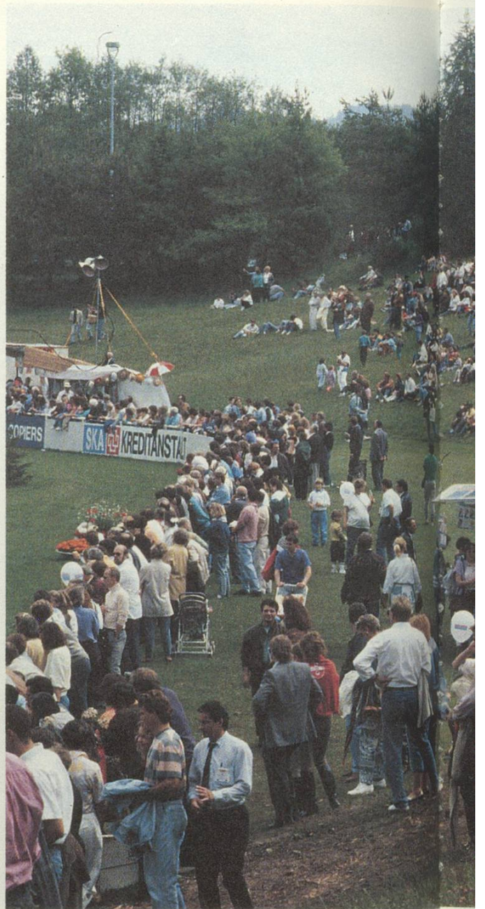
Jeder suchte sich seinen idealen Platz