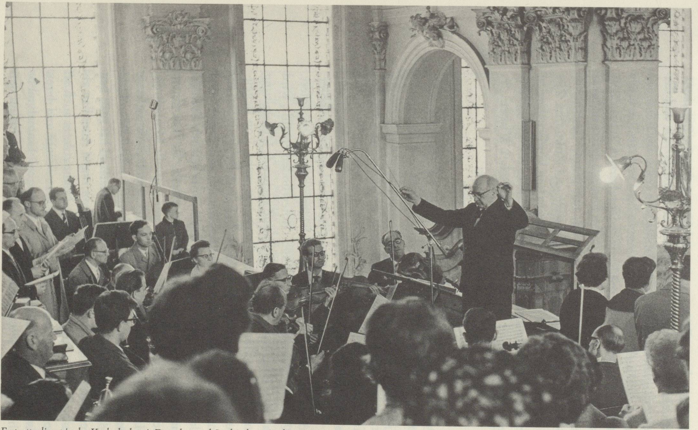
Festgottesdienst in der Kathedrale mit Domchor und Städtischem Orchester. Die Aufnahme erfolgte vor 1967, dem Datum der Innenrenovation der Kathedrale.