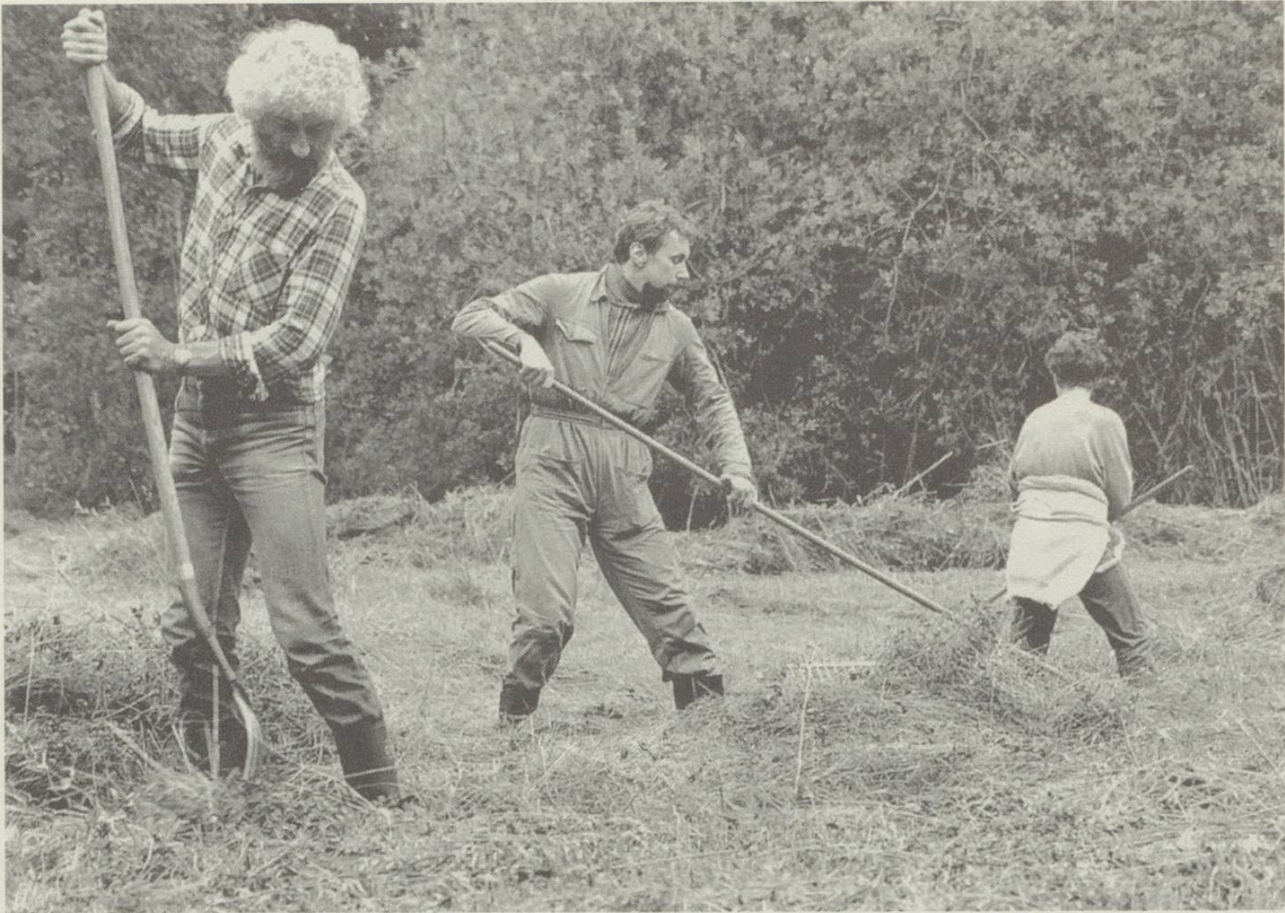
Schutzgebiete brauchen jährlich einen Pflegeeinsatz: Im Schutzgebiet «Hubermoos» rechen Frauen und Männer der NVS-Arbeitsgruppen das gemähte Rietgras zusammen und tragen es weg.