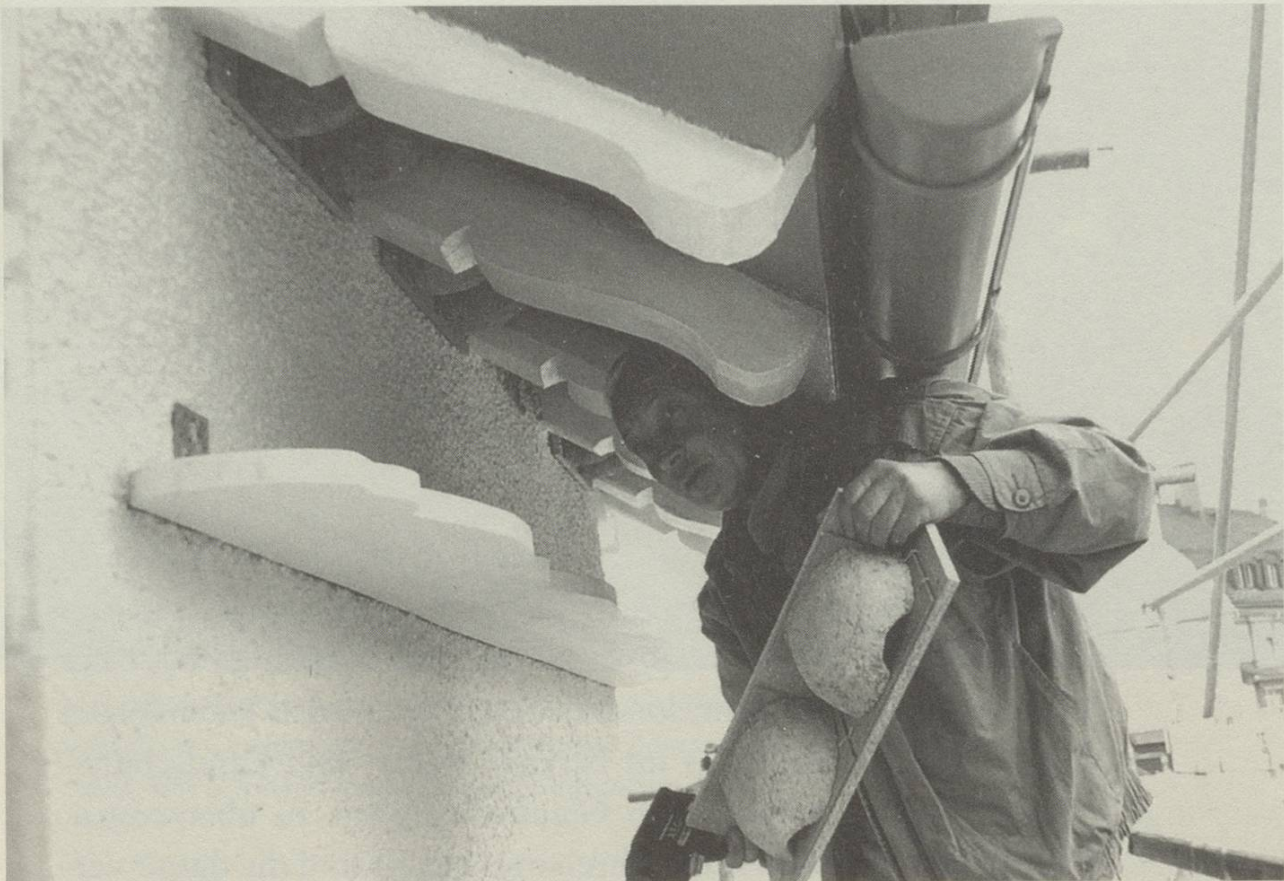
Im Rahmen des praktischen Vogelschutzes kann der NVS Hausbesitzer und Bauleute ab und zu dafür gewinnen, an der Baute künstliche Schwalbennester anzubringen.