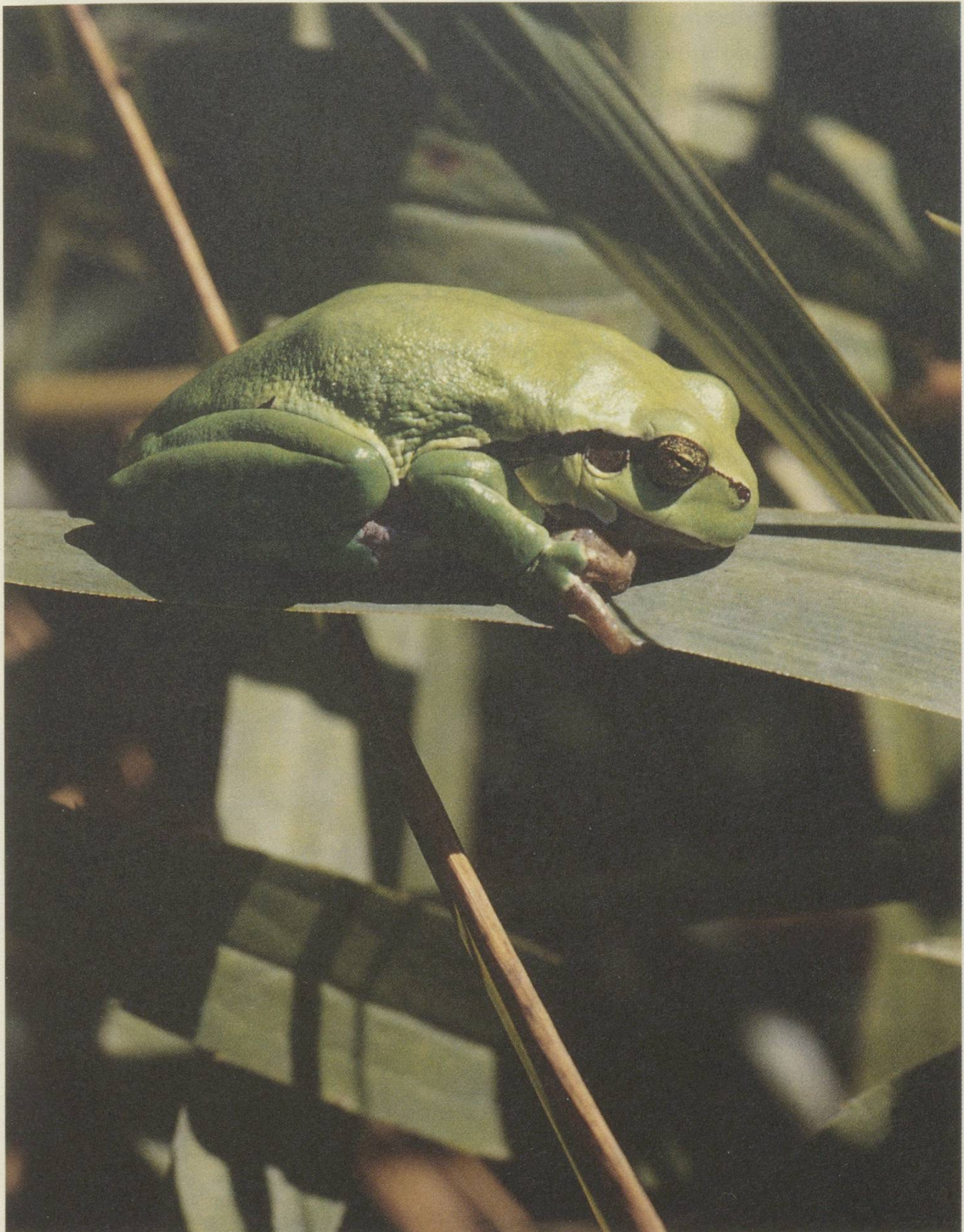
Laubfrosch, in St.Gallen und Umgebung nur noch selten anzutreffen.

25 Jahre Naturschutzverein der Stadt St.Gallen und Umgebung