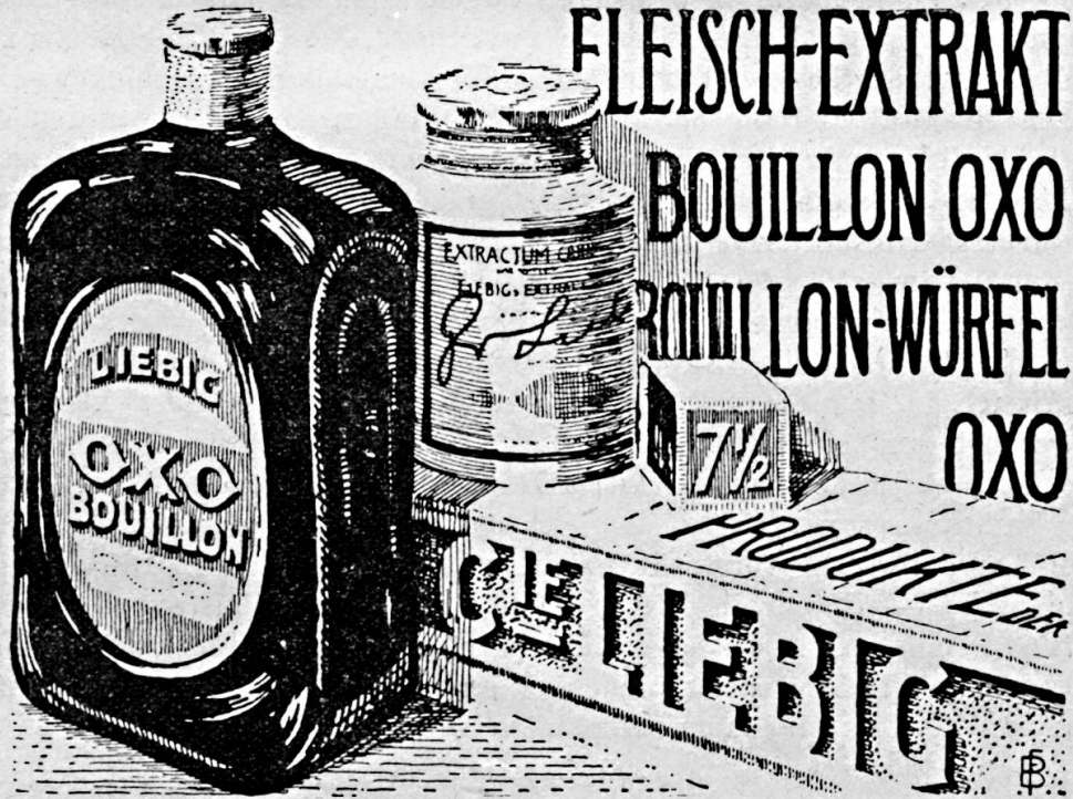
Bl. 620 g