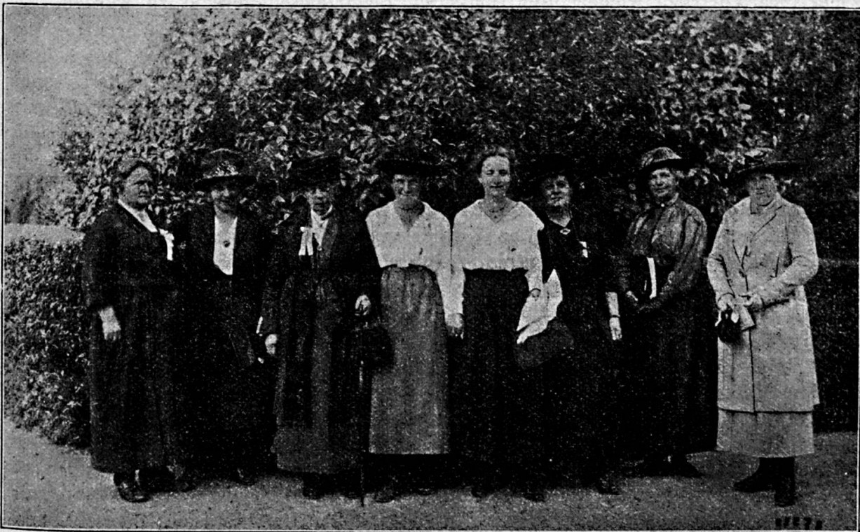
Einige Mitglieder des Organisationskomitees und seines Arbeitsausschusses

Zweiter schweizerischer Kongress für Fraueninteressen in Bern 1921