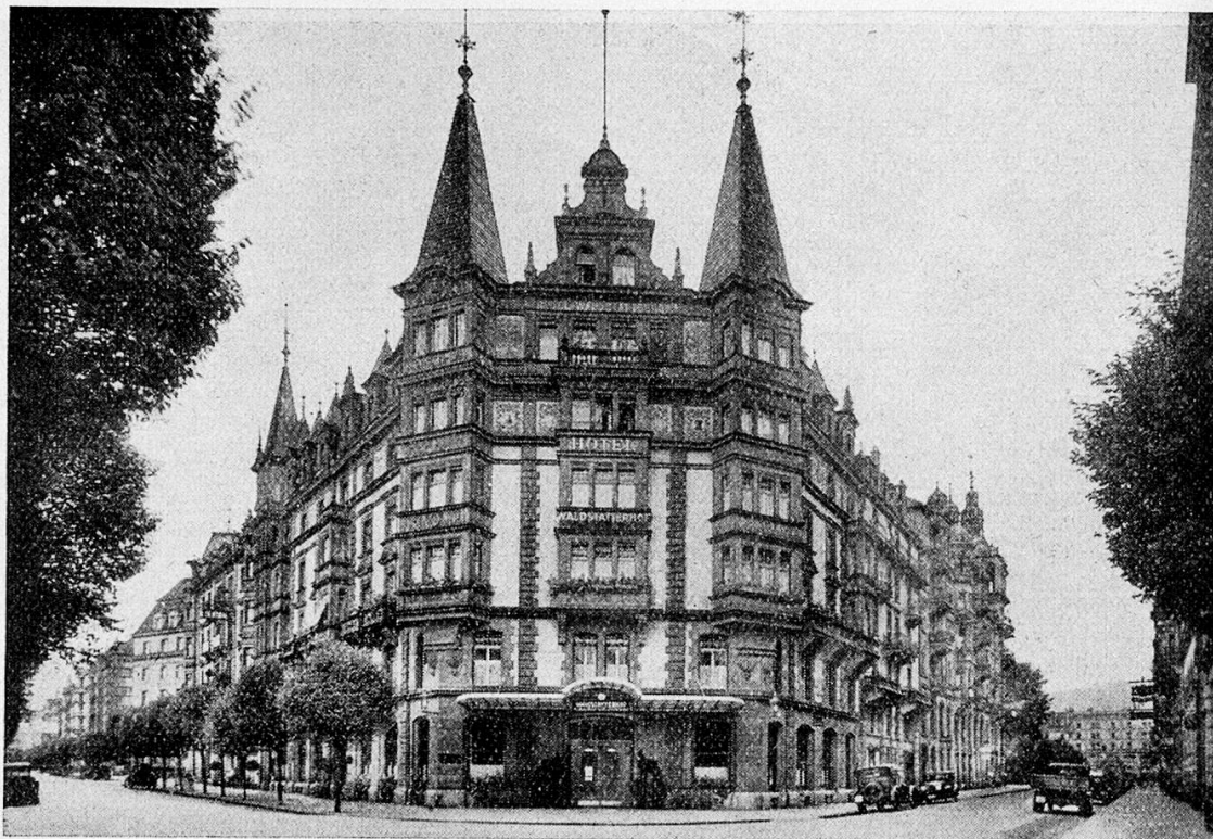
Das alkoholfreie Hotel Waldstätterhof beim Bahnhof 1923 käuflich erworben

1900 : Aufnahme des Planes zur Errichtung eines « Alkoholfreien Restaurants », dessen Eröffnung erst 1918 erfolgen konnte.