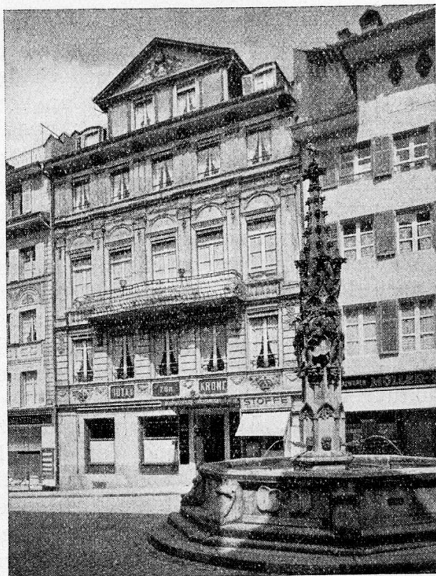
Das alkoholfreie Hotel Krone am Weinmarkt, ehemals Zunfthaus zur Gerwern, ging 1925 in den Besitz des „Frauenvereins“ über.

dank der Umsicht der Frauenliga zur Bekämpfung der Tuberkulose, welche aus Erfahrung weiß, daß « vorbeugen besser geht, als heilen ».