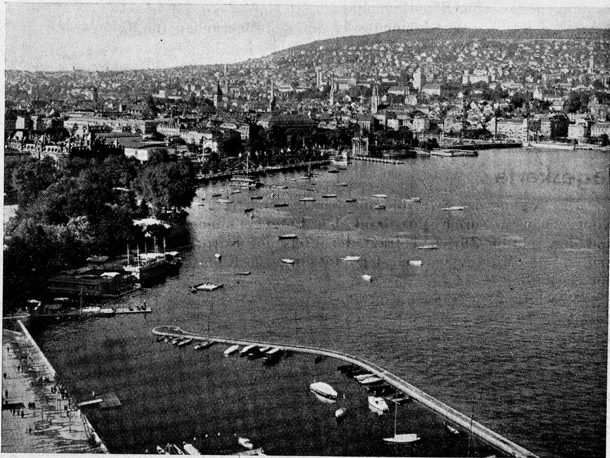
Zürich mit See

———— Nachdruck ist nur mit Erlaubnis der Autoren und der Redaktion gestattet ————