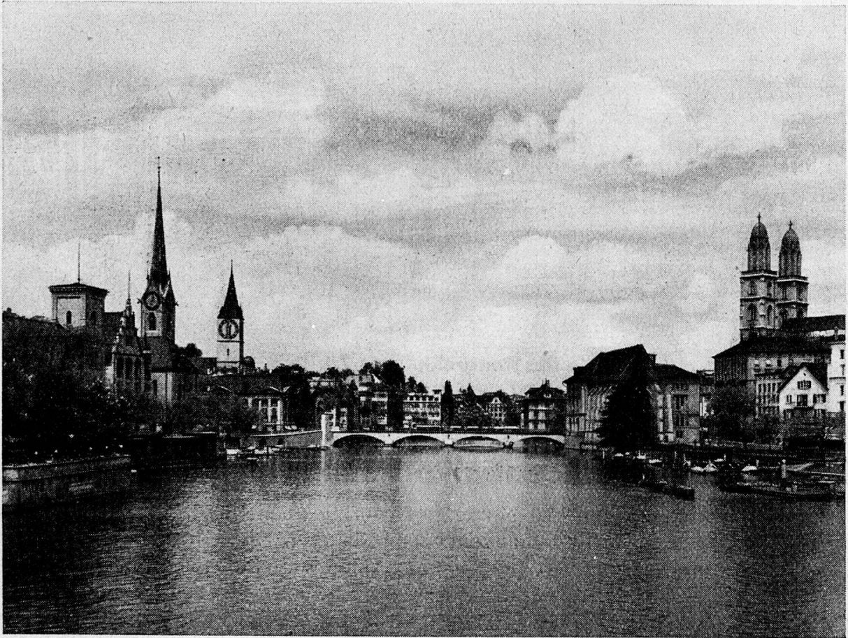
Zürich mit Blick auf Großmünster, Fraumünster und Peterskirche