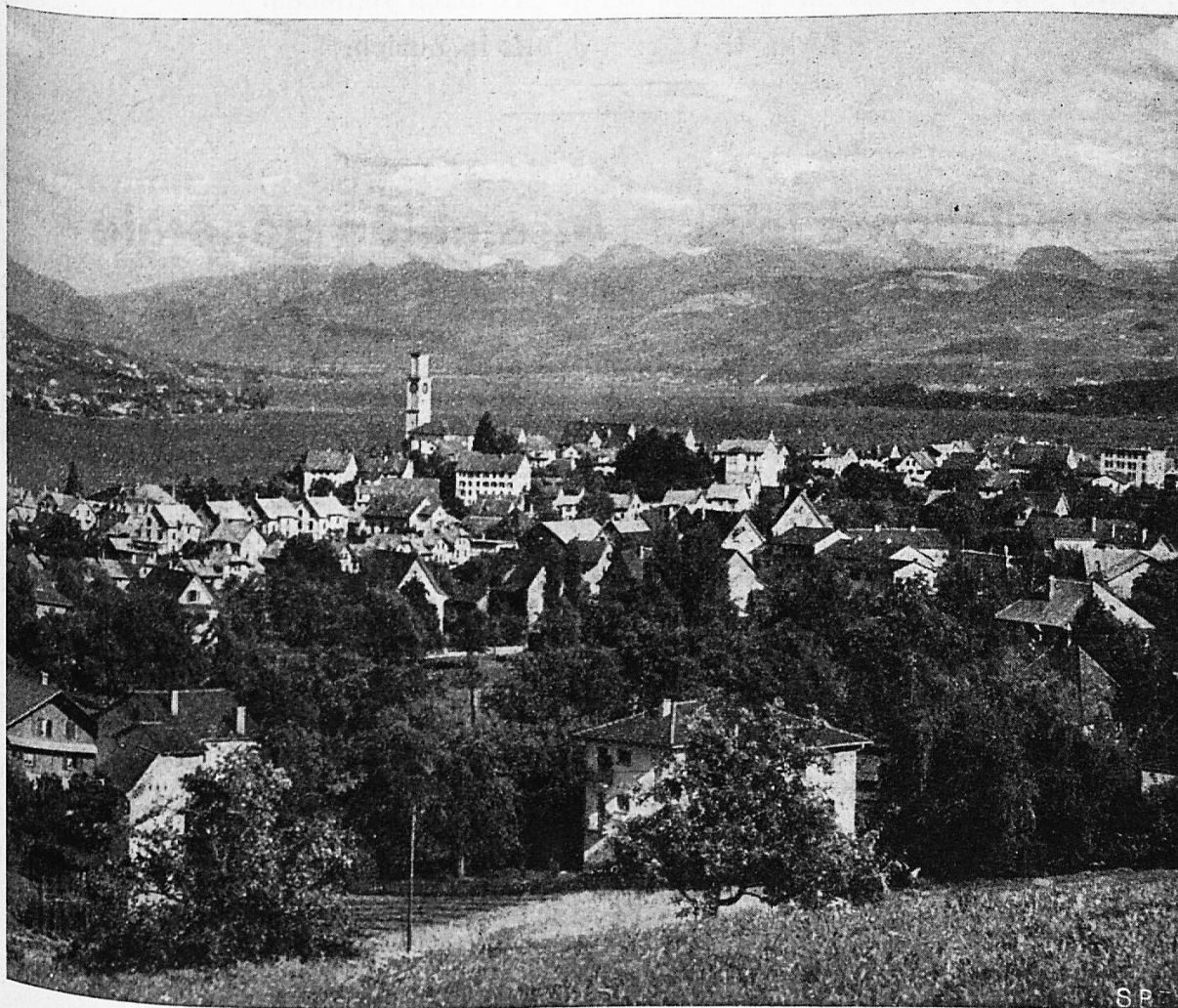
Thalwil am Zürichsee