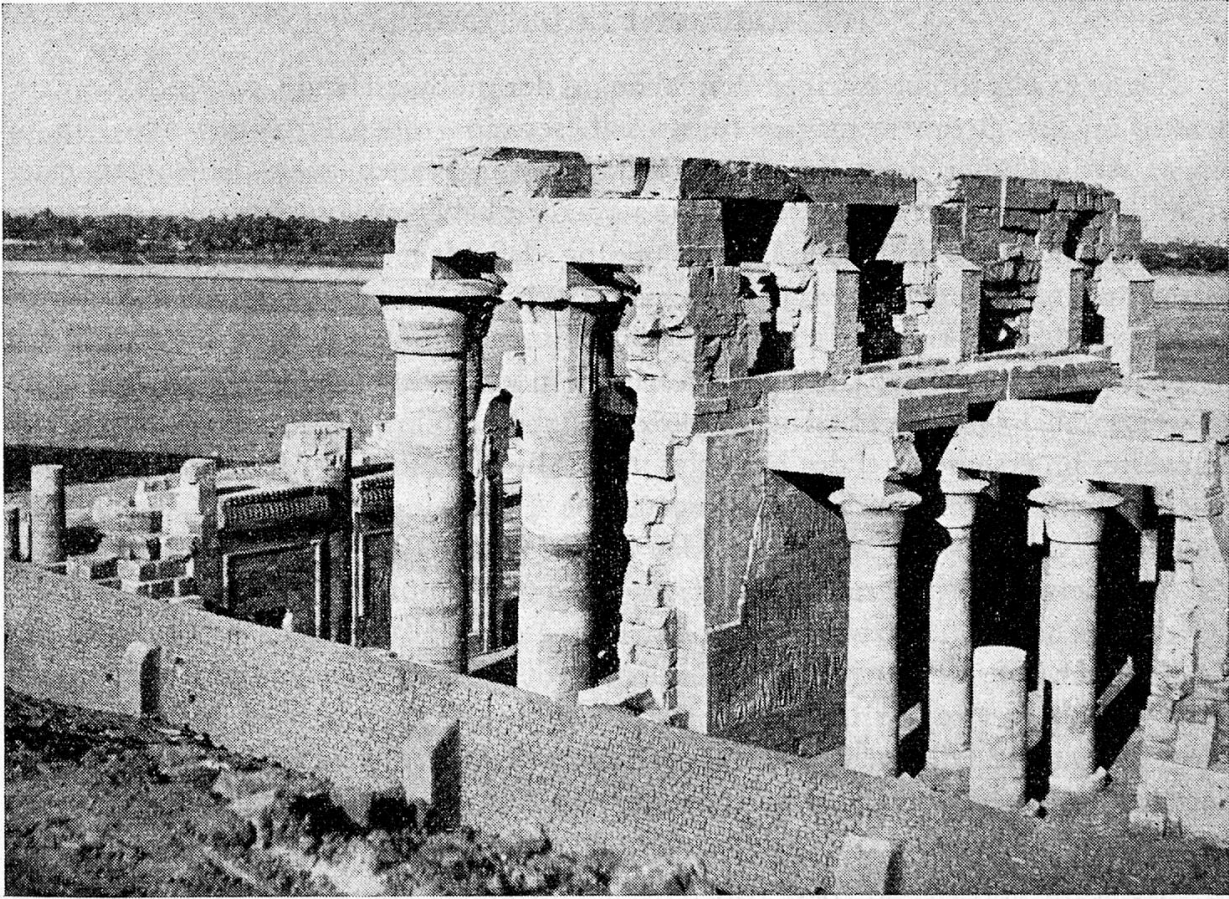
Tempel in Kom Ombo