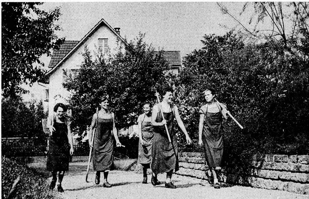
Auf dem Weg zur Arbeit