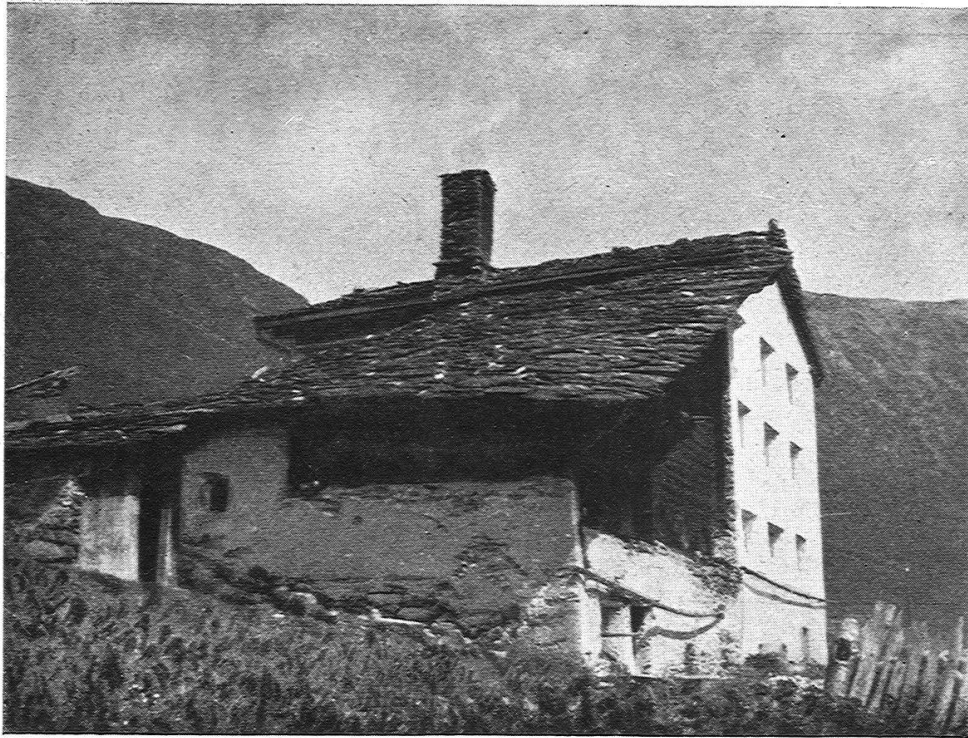
5. Wohnhaus No. 22 in Oberjuf. Links alter, rechts neuer Hausteil. («Höfli», d. h. vorgezogener Hauseingang.)