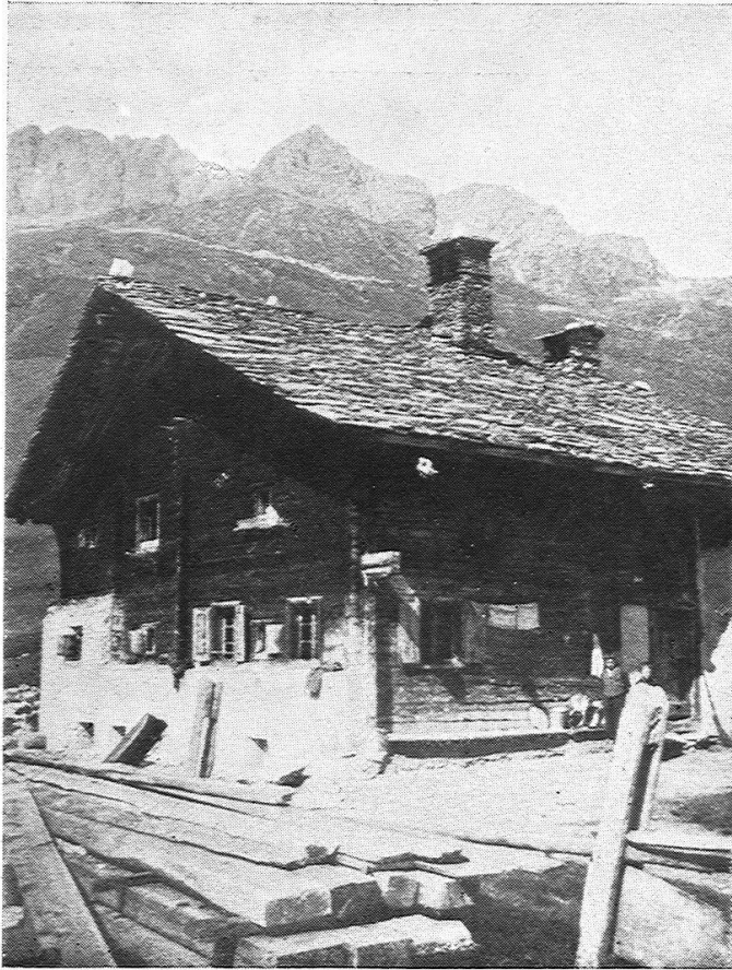
4. Wohnhaus in Bregalga, unterhalb Juf. Alter Haustypus. (Beachte die Mauerverkleidung an der Vorderfront, die kleinen Fenster mit «Tütschi», die Dachsteine).