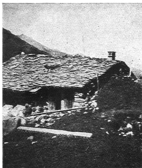
Phot. W. W. 2. Wohnhaus Nr. 6 in Unter-Juf. Typus des alten Wohnhauses. (Beachte den Lawinenschutz auf der Hinterseite.)