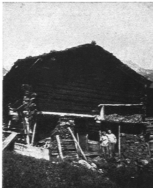
3. Stall Nr. 17 in Ober-Juf. Typus des einfachen Stalls mit Giebelfront. (Beachte die zum Trocknen aufgeschichteten Schafmistziegel vor dem Stall.)