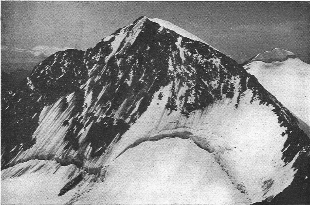
Abbild. 4. Verwitterung und Bergschrund am Piz Zupo.

scherzunge entstanden sein kann oder abgelagert worden ist, sondern dass seine streifenartige Erscheinung tatsächlich mit der Struktur des Gletschers in engstem Zusammenhang steht. Dazu kommt die Tatsache, dass bei vielen Gletschern die Schmutzbänder der untersten, dem Gletscherende am nächsten liegenden Eisschichten nicht nur Sand und Staub, sondern auch grössere Gesteinstrümmer aufweisen. Teils rühren sie, infolge von Abscheurungsvorgängen, aus der Grundmoräne her, teils stammen sie