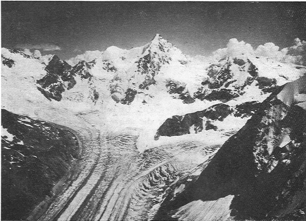
Abbild. 2. Blick auf den Zinalgletscher von den „Bouquetins“.

streifen gletscherabwärts mehr und mehr verblassen, undeutlicher werden müssten, da das oberflächlich ab rinnende Schmelzwasser auch den nur oberflächlich auflagernden Staub mehr und mehr wegschwemmen würde. Allein dies trifft nicht zu; man hat eher den Eindruck, dass die Ogiven gletscherabwärts deutlicher ausgeprägt sind als weiter oberhalb. Dies zeigt sich namentlich auf einer prächtigen, von Kapitän Spelterini gemachten Ballonaufnahme des « Mer de Glace », die bei Wehrli in Kilchberg