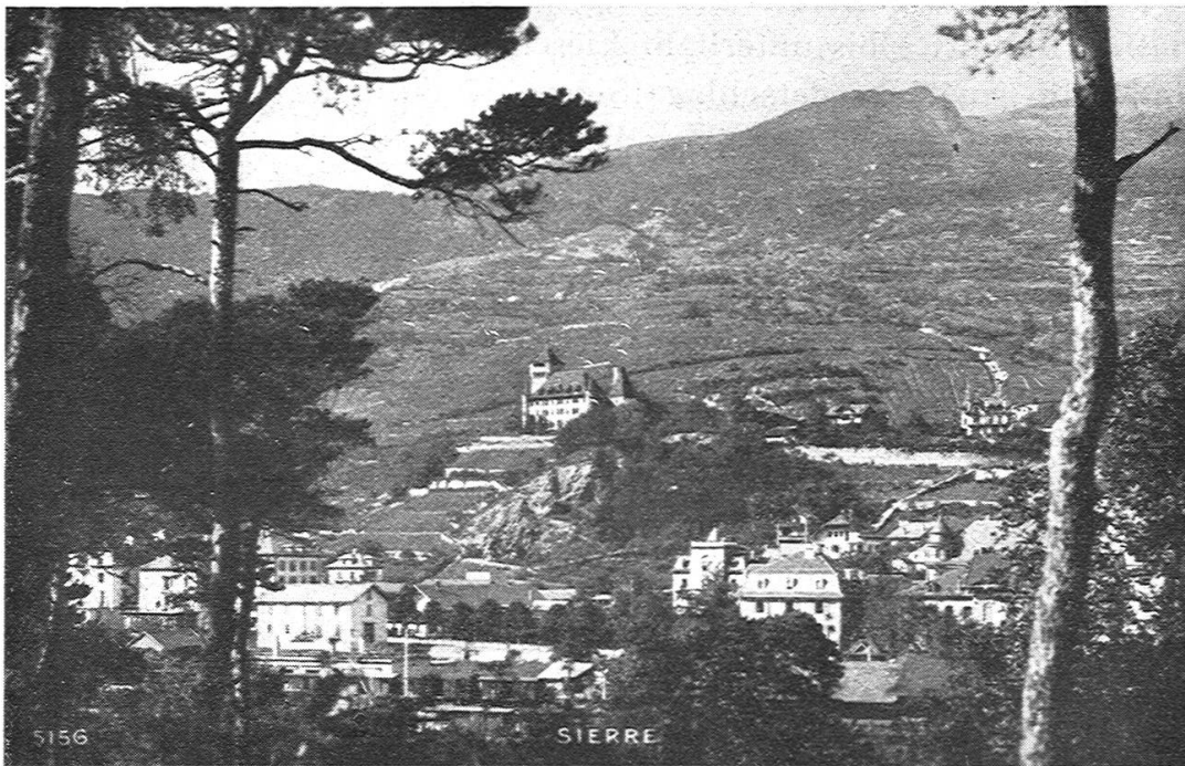
Fig. 1. Siders mit dem nördlichen Berghang. (Aus dem Album de Sierre Edit. Art. Perroche-Matile, Lausanne).

Verbandes, der Schweizerische Geographielehrerverein, hat den geringsten persönlichen Kontakt, da seine 370 Mitglieder über das ganze Land zerstreut sind. Der von ihm in Verbindung mit der Firma Kümmerly & Frey, die dafür Opfer bringt, gegründete «Schweizer Geograph» bildet das Band, das alle Mitglieder umschlingt. Ihn auszubauen und ihm neue Freunde zu werben, wird unsere stete Sorge sein. Die Geographische Gesellschaft Bern und die Geographisch-Ethnographische Gesellschaft Zürich referieren regelmässig in unserer Zeitschrift über ihre Vorträge und Exkur-