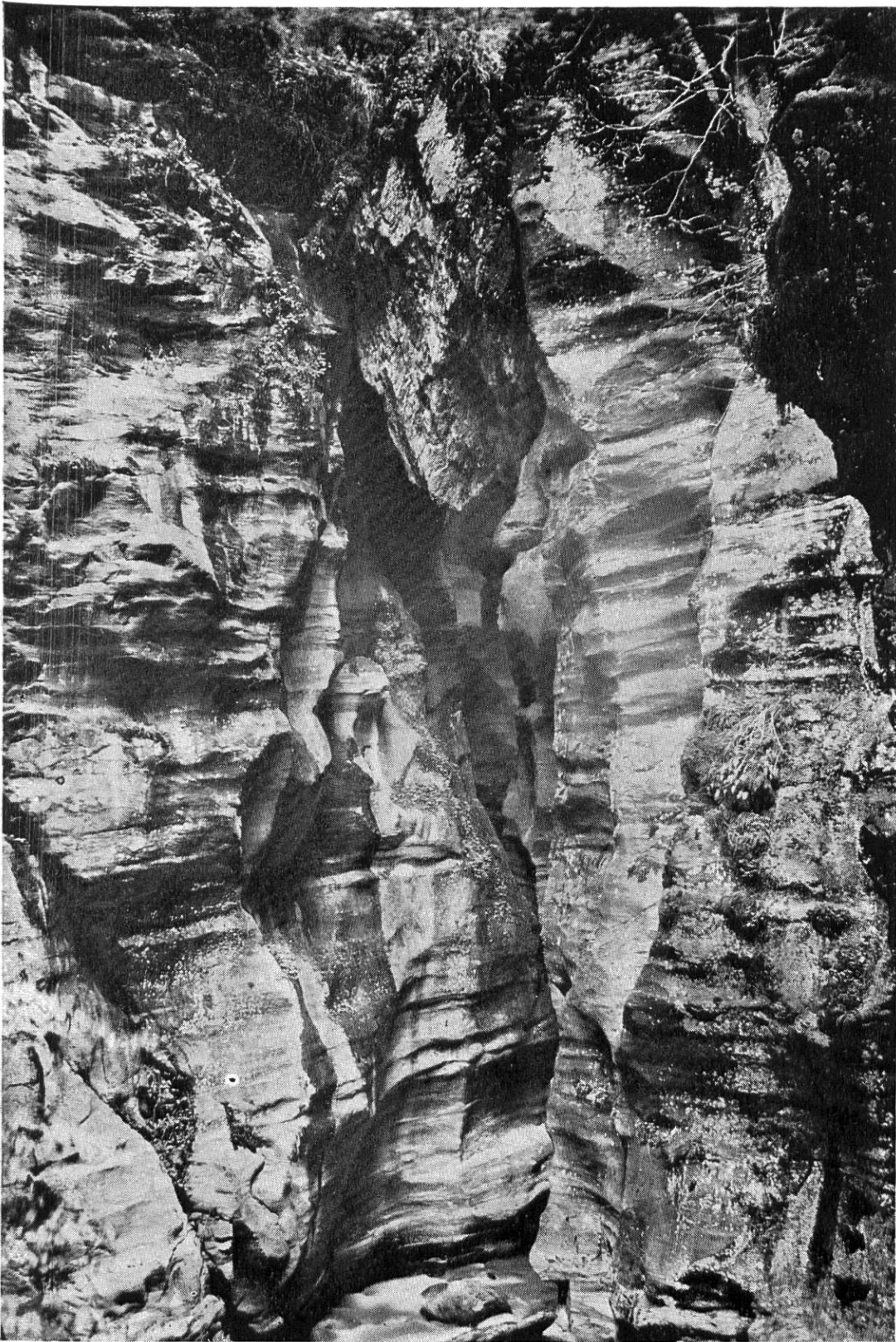
Ansicht der oberen Naturbrücke («Gwölbe») im Schilztobel ob Flums mit Schlußstein von außen (Norden).

Aufnahme von Herrn Direktor Knecht, Oktober 1906.