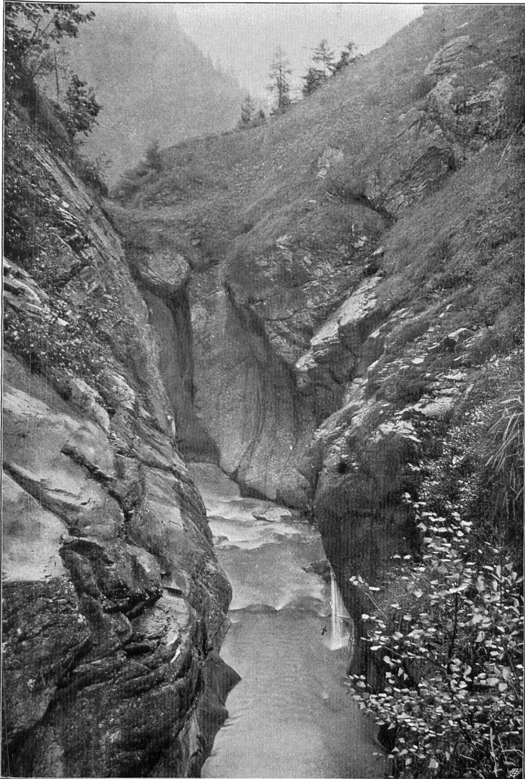
Naturbrücke über die Tamina bei Fluah W Vättis. Aufgenommen von Westen durch F. W. Sprecher, 30. September 1906.