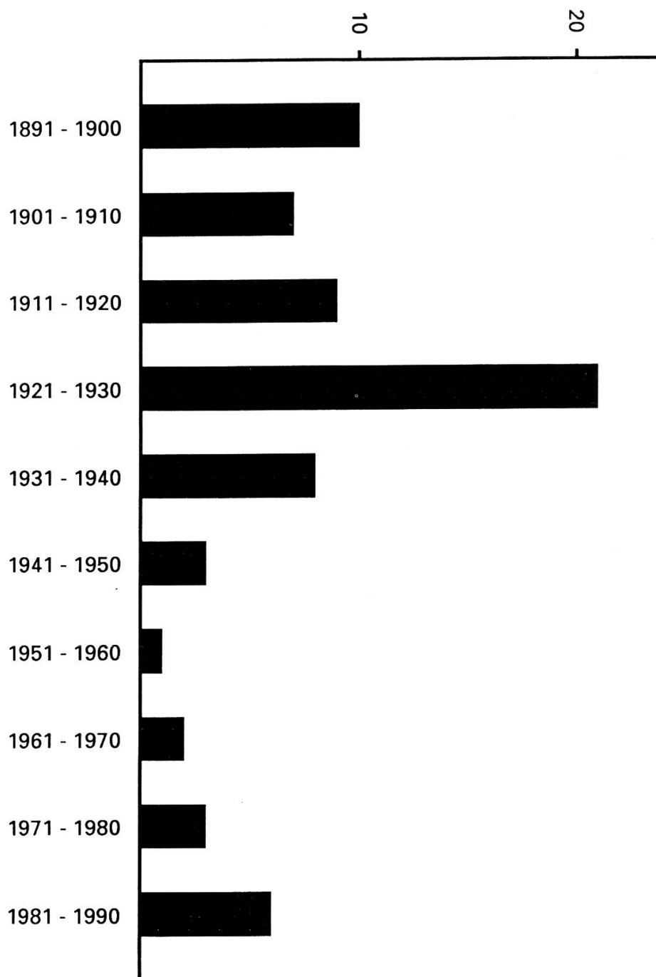
Abb. 2: Abschluss- und Unfallstatistik der Waldkatze in der Schweiz.