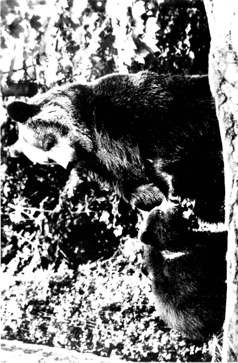
Abb. 1: Nachdem um die Jahrhundertwende der Bär in der Schweiz ausgerottet war, denkt man heute anders und überlegt sich ernsthaft, ob dem Alpenbären nicht doch noch eine Chance gegeben werden könnte.