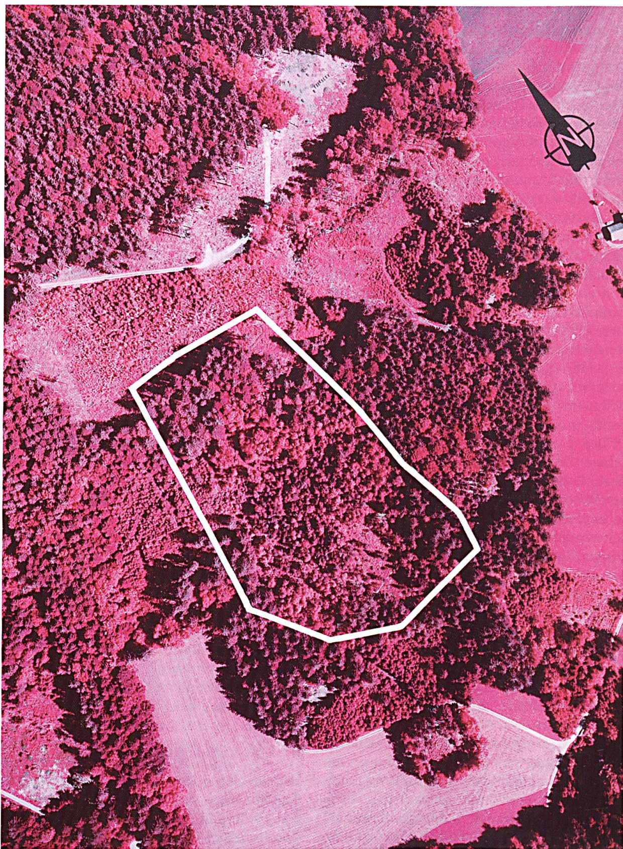
Abbildung 1: Farbinfrarot-Luftbild vom Rotmoos (Gde. Degersheim, SG) mit Parzelle 1189 als Kartierungsperimeter (Luftaufnahme der V+D vom 21.08.1993, Fluglinie 034016, Bild-Nr.: 7706, Bildmassstab ca. 1:3000).