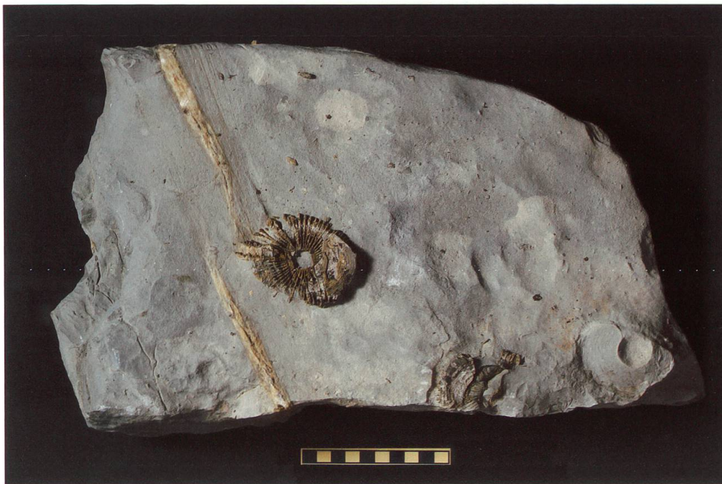
Abbildung 6: Fundplatte 4 vom Chäser- rugg, NMSG P 5782.4 weist eine Länge von 45 cm, eine Breite von 25 cm und eine Höhe von 10 cm auf. Diese Platte weist zwei deutliche, versetzte Calcitbänder auf. Auf ihr sind zwei unvollständ- ige, stark verwitterte Wirbel sowie der Abdruck eines dritten Wirbels zu sehen. Deren Masse betragen 74 x 58 x 9 mm, 63 x 41 x 9 mm und 64 x 45 mm. Der Massstab entspricht 10 cm.