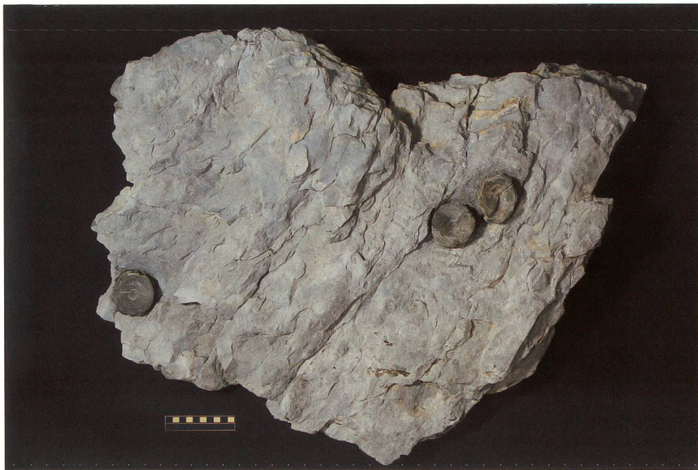
Abbildung 16: Fundplatte 14 vom Chäs- errugg, NMSG P 7037.1 stammt aus einer etwas höheren Lage als der Hauptfund und wurde erst bei der Bergung der grossen Platte entdeckt. Sie weist eine Länge von 88 cm, eine Breite von 64 cm und eine Höhe von 10 cm auf. Auf ihr sind drei nahezu vollständig erhaltene Wirbel zu sehen. Deren Masse betragen 66 x 60 x 17 mm, 66 x 65 x 17 mm und 62 x 57 x 18 mm auf. Der dritte Wirbel weist einen tektonischen Bruch quer durch den Wirbelkörper auf. Der Massstab entspricht 10 cm.