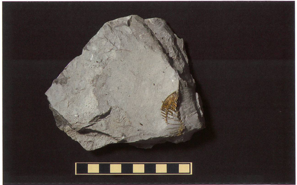
Abbildung 15: Fundplatte 13 vom Chäser- rugg, NMSG P 5782.13 weist eine Länge von 10,5 cm eine Breite von 6 cm und eine Höhe von 3,5 cm auf. Auf ihr ist ein sehr unvollständig erhaltener Wirbel zu sehen. Seine Masse betragen 38 x 13 mm. Der Massstab entspricht 10 cm.