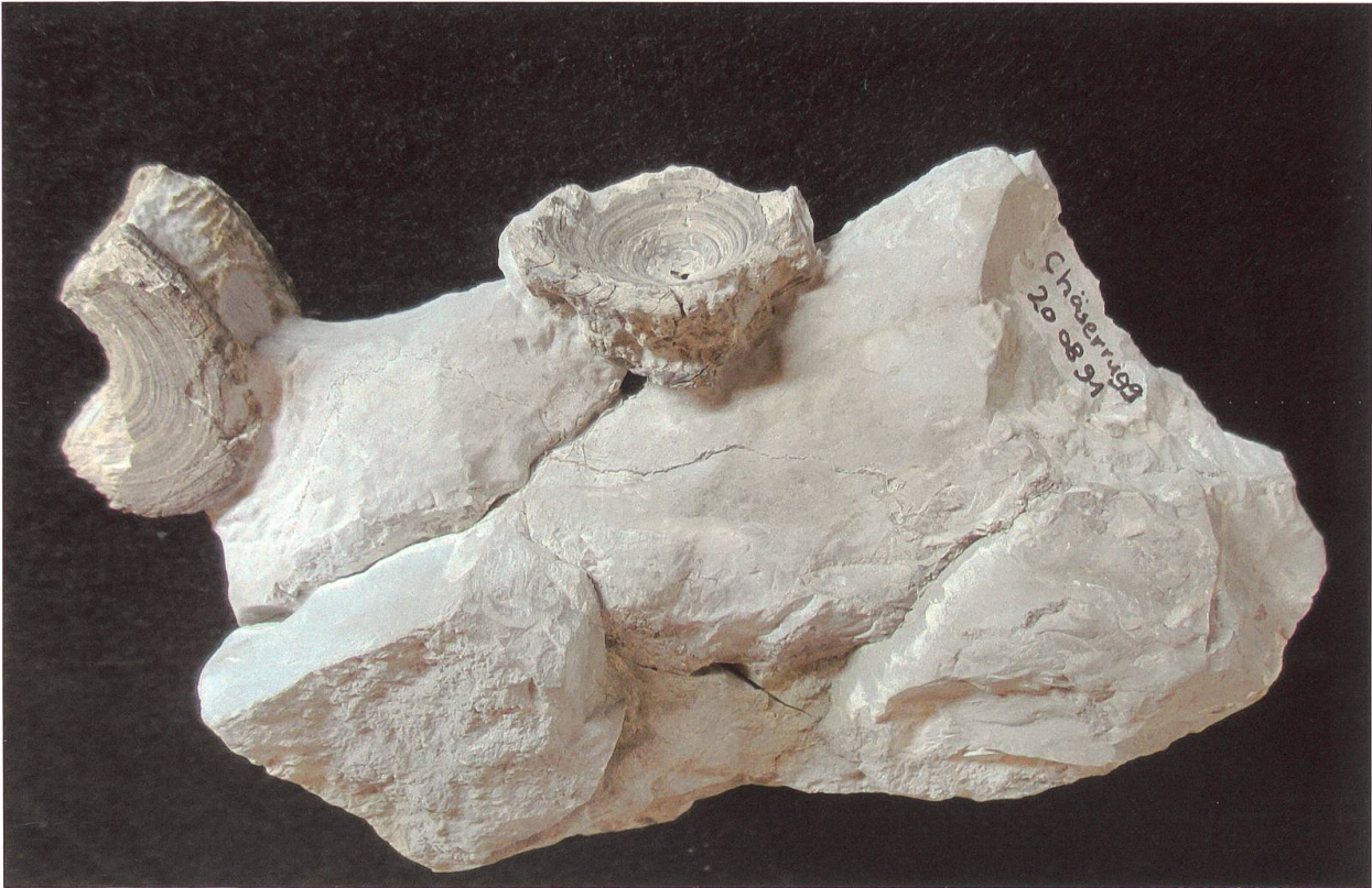
Abbildung 2: Zwei, am 20. August 1991 von D. Müller gefundene Wirbel vom Chäserrugg. Das Fundstück ist 16 cm lang, 16 cm breit und 6 cm dick und befindet sich in der Privatsammlung von Urs Oberli. Einer der beiden Wirbel mit einem Durchmesser von ca. 55 mm und einer Höhe von 23 mm ist halbiert und angewittert, der andere, mit einem Durchmesser von ca. 39 mm und einer Höhe von 16 mm, ist am Rande stark angewittert.

geborgen. An einer anderen grossen Platte, nahe beim Hauptfund, konnte zudem der Rest eines Zahns aus dem Stein gemeisselt werden. Bei der anschliessenden Präparation der grossen Platte kamen insgesamt 13, mehr oder weniger vollständig erhaltene Wirbel zum Vorschein (Abbildung 1).