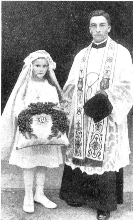
Primiziant aus dem Bündner Oberland mit Kranz.

Für jede katholische Gemeinde ist es ein Festtag, wenn ein junger Priester aus derselben zum erstenmal an den Altar tritt, seine Primiz feiert. Für die Verwandtschaft ist es ein Ehrentag und für die Mutter des Primizianten der Höhepunkt der Freude, denn für sie ist es der Tag, den sie schon lange ersehnte und den sie schon oft fürchtete nicht mehr erleben zu können. Für diesen Tag und die Zukunft wählt sich der Neupriester eine geistliche Verwandtschaft, die von nun an zu ihm steht, wie die leibliche seit der Geburt. Überall erwählt er sich einen geistlichen Vater, der ihn zum Altar führen soll, und an den meisten Orten auch eine geistliche Mutter, die mehr für sein leibliches Wohl besorgt