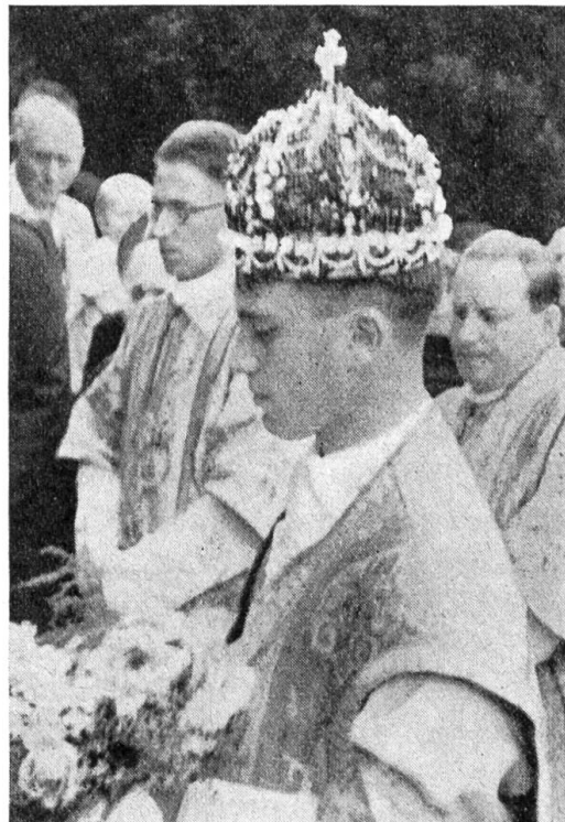
Primiziant aus Steiermark mit Krone.

Im Mittelalter trugen junge Herren und Damen den Schapel. Seit dem Ende des Mittelalters ist er den Jungfrauen geblieben als Zeichen ihrer Jungfrauschaft, zuerst für jeden feierlichen Kirchgang, dann nur noch für besonders festliche Anlässe, für