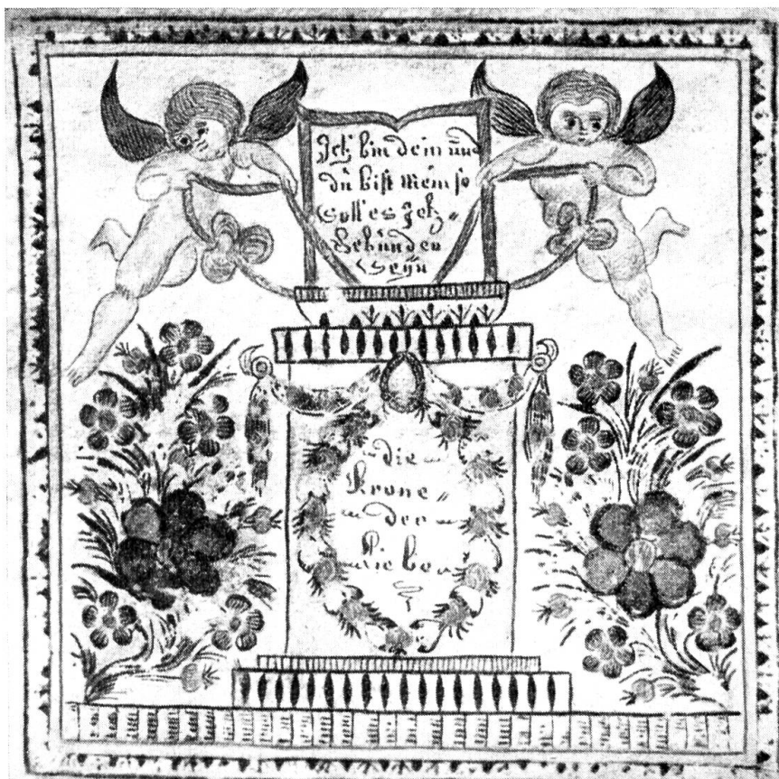
Verlöbnißbrief aus Oberhofen-Münchwilen (zusammengefaltet; Rückseite)