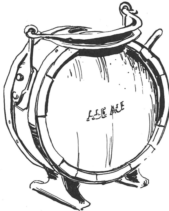
„Lögeli“ aus der Sammlung Erzer in Dornach.