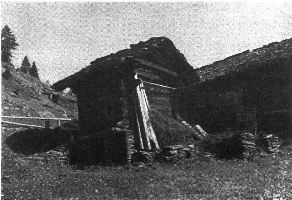
Abb. 1. Schlafhaus im Monte Valbella (Calanca, Kt. Graubünden). Fast quadratischer Kantholzblock mit stark ausladendem Pfettendach. Der gemauerte Unterbau dient als Keller. An der Traufseite findet sich die Türe, erreichbar über eine kleine Laube. An der Giebelseite bemerkt man die kleinen Fensterlucken, sowie Reste eines Trockengestelles.

Durch Zufall stiessen wir im Val Calanca (Kt. Graubünden) auf zahlreichen Maiensässen (Monti genannt) neben den üblichen Wohn- und Wirtschaftsgebäuden auf kleine, unscheinbare Blockbauten. Ein Blick durch die unverschlossenen Türen oder durch die kleinen, aus einem Balken herausgeschnittenen Fenster ins Innere liess einen einfachen Schlafraum erkennen (Abb. 1).