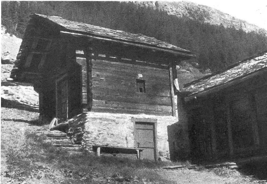
Abb. 3. Neueres Schlafhaus in Valbella. Der ursprüngliche Habitus ist gewahrt, auch das weit vorgezogene Dach fehlt nicht. Der Unterbau enthält einen Milchkeller. Der Herdraum befindet sich im quer dazu stehenden Wirtschaftsbau (Heustall mit Wohnküche).

zahlreichen Speichern einzelne Kammern als Schlafgemache gebraucht werden. Dies erklärt, warum oft der Ausdruck „Schlofhus“ auf solche Speicher übergegangen ist. Der zitierte Ortsname verdankt sicher diesen Verhältnissen seinen Ursprung.