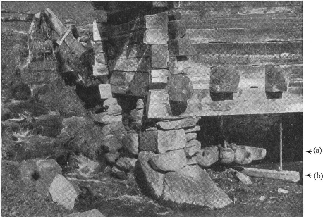
Abb. 2 : Kundenmühle in Verbier mit horizontalem «Löffelrad» (a); Steg, der das Rad trägt (b); «Schusskennel» (c)

Brummen schwerer Diesel-Lastwagen. Auch im savoyischen Beaufortin und in der Tarentaise mahlen kleine Mühlen das gesamte Korn des Dorfes. Am besten erhalten blieb natürlich der bäuerliche Mühlenbetrieb in den hochgelegenen, schwer zugänglichen Dörfchen.