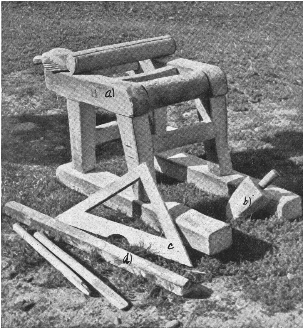
Abb. 4: Reckingen: a) «Schärfestuhl»; b) Keil; c) Bleiwaage; d) Scheit zum Schwärzen der Steinoberfläche

schweizerische Mühlenkarte noch neun kleine Mühlen von St. Niklaus bis Zermatt; aber ihr Betrieb ist kläglich zusammengeschrumpft. In Zermatt gab es früher gut beschäftigte Kundenmühlen. Seit den letzten Jahren bezieht der berühmte Fremdenort allein ca. doppelt so viel Mehl aus dem Unterland als das ganze Val d'Anniviers oder das Lötschental. Ein typisches Bild bietet weiter das Leukertal. In Leuk, Inden und Leukerbad, alle Orte durch Bahn und Autostrasse mit dem Rhonetal verbunden, ist das einheimische Müllereigewerbe schon fast ausgestorben. Dagegen im höher gelegenen Albinen, das nur auf einem holperigen Saumweg erreichbar ist,