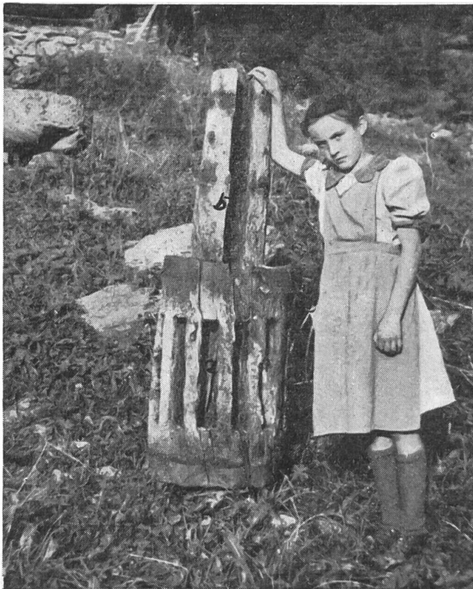
Abb. 3 : St-Luc (Anniviers) : Ausgedienter, hölzerner «Radstock». a) Kerben der flachen Schaufeln. b) Kerbe für das Mühleisen

Mühsam ist das Pflügen und Ernten auf den steilen und schmalen Äckern von Isérables, Albinen, Saint-Martin usw. Sogar der Mist muss auf dem Rücken von Mensch und Maultier getragen werden. Jedes Jahr rutscht die trockene Erde hangabwärts. Starke Bäuerinnen schaffen sie im Rücken-tragkorb (Tschivere) wieder hinauf. Doch schliesslich können die Leute weisseres Handelsmehl beim Spezereihändler so billig kaufen, dass sich ihre unendliche Mühe nicht mehr lohnt.