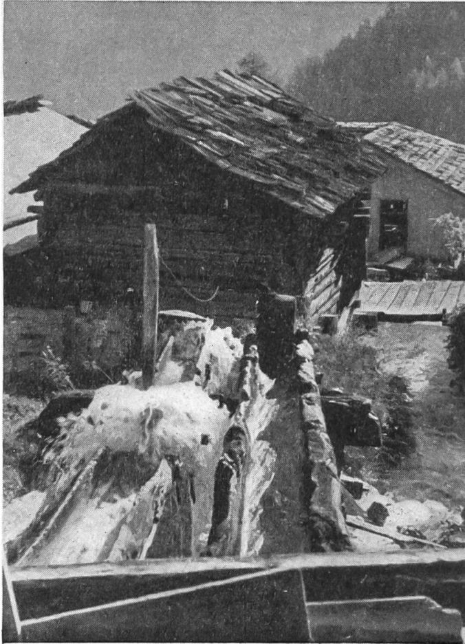
Abb. 1: Gemeindemühle in Grimentz; zwei Schusskennel, links geschlossene, rechts offene Schleuse