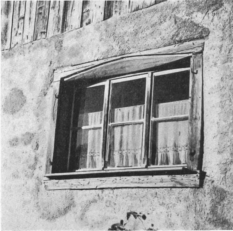
Aufnahme: G. Bienz, 1945—47

Courchapoix (E Delsberg): Dreiteiliges Fenster mit Holzrahmen (wohl 18. Jh.).