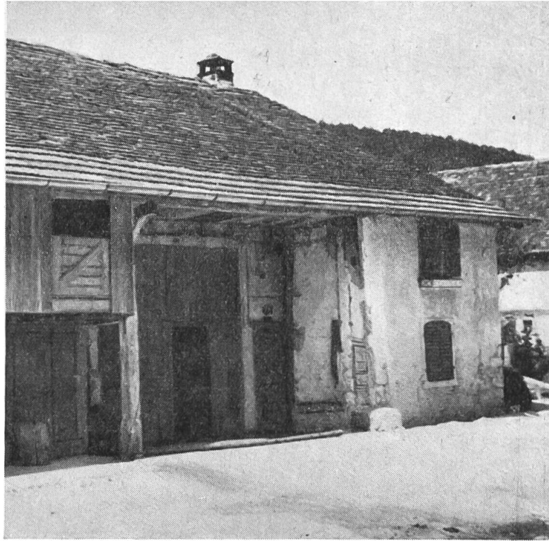
Aufnahme: G. Bienz, 1945—47

Ederswiler (N Delsberg): Strassenfront eines wohl mindestens aus dem Anfang des 18. Jh. stammenden dreisässigen Hauses mit devant' buis ; offener Zugang zu Stall, Scheune und Gang. In höheren Lagen ist das devant' buis meist eingeschalt und zunächst nicht erkennbar. Der Wohnteil aus Stein mit barock gerundeten Fenstern, die Wirtschaftsteile noch weitgehend aus Holz.