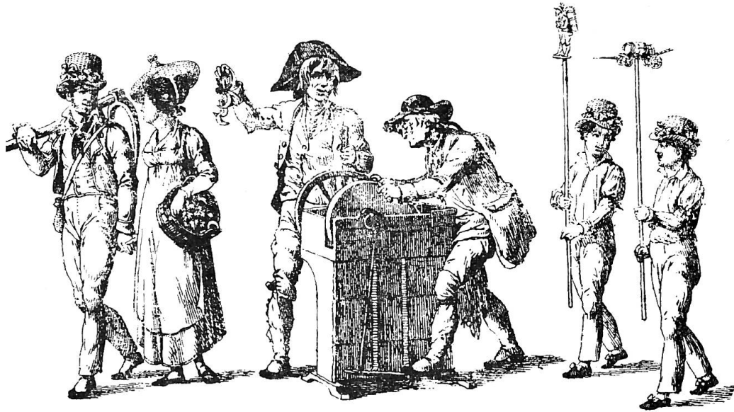
Selbstdarstellung 1819, Vevey Fête des vignerons