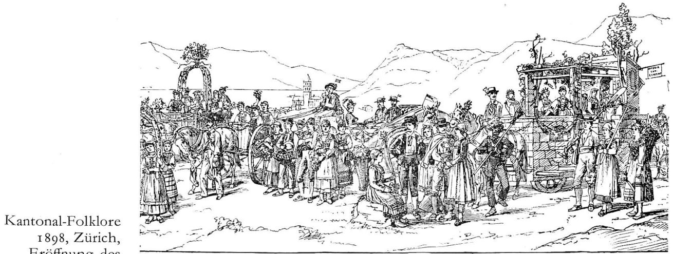
Kantonal-Folklore 1898, Zürich, Eröffnung des Landesmuseums