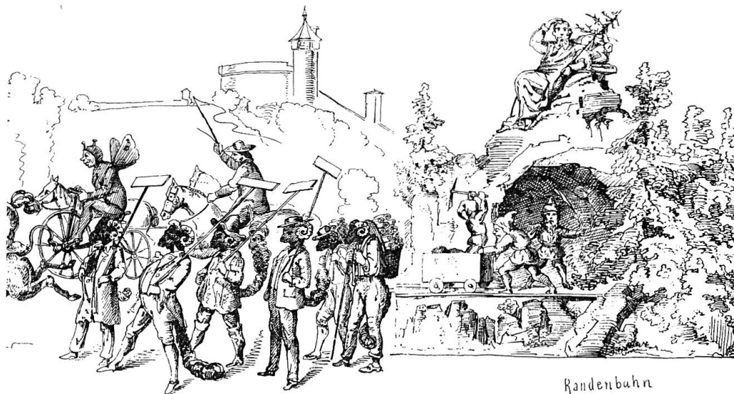
Ironische Selbstdarstellung 1870, Schaffhausen, Fastnacht