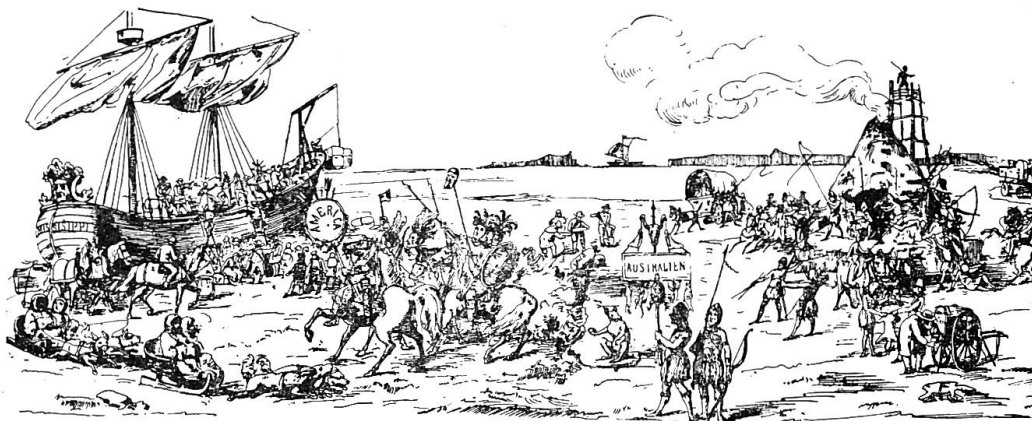
Exotik 1866, Luzern, Fastnacht