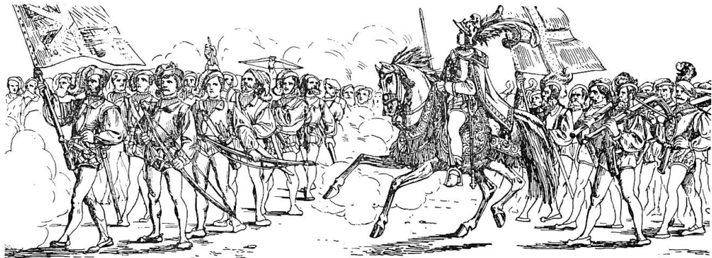
CORPS DES ARCHERS.