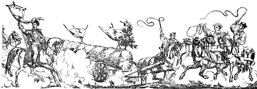
Brauchvorführung als Folklore im engeren Sinne 1863, Bern, Ostermontag