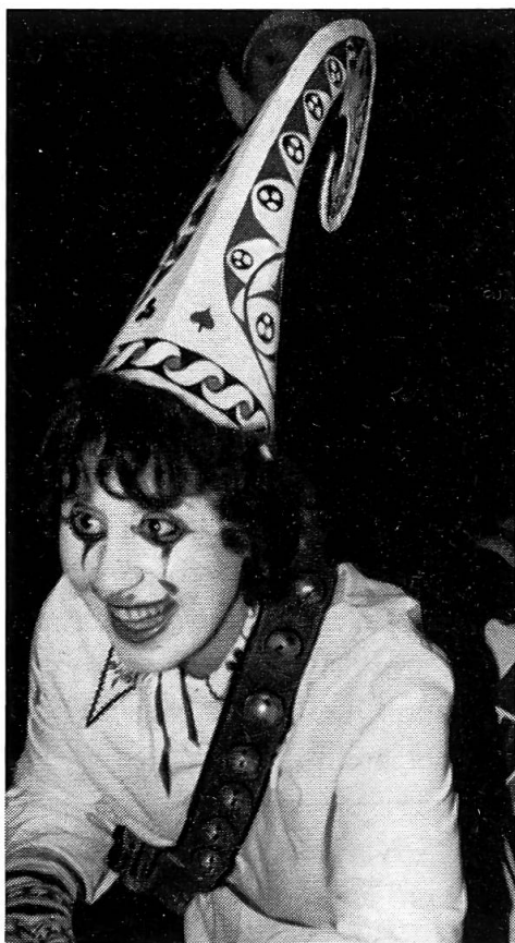
Ein «Geiggel» am großen Umzug