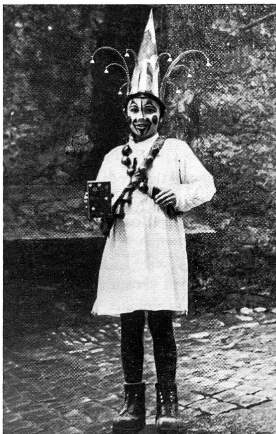
«Kinder-Geiggel» in den vierziger Jahren