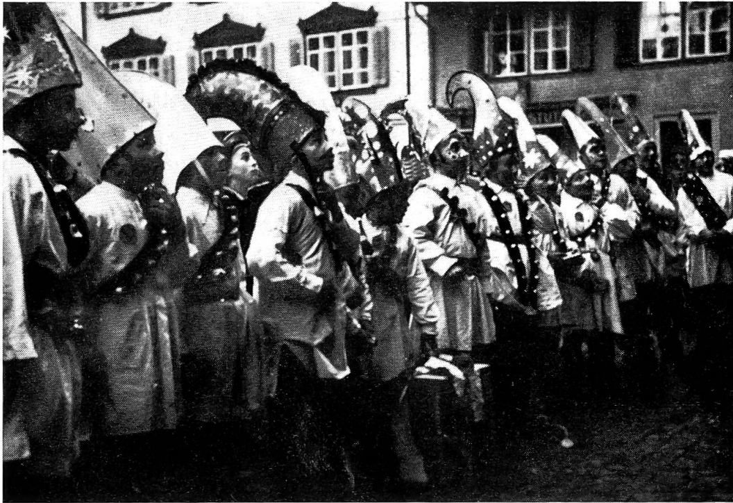
Preisverteilung nach dem Wettbewerb von 1943

mehrere Geiggel , je nach Größe der Klasse. So ist es denn eine große Ehre, gewählt zu werden. Der kleine Geiggel setzt alles daran, möglichst viel Geld in seine Kasse zu bekommen, denn dieses wird nachher vom Lehrer unter die Kinder der ganzen Klasse gleichmäßig verteilt. Im Unterschied zu den Geiggeln des großen Umzugs gehen die Kinder-Geiggel oft völlig unabhängig von den Treichlergruppen in alle Häuser, und dies etwa nicht immer zu Fuß, auch das Velo wird benutzt oder ein Wägelchen mit vorgespanntem Pony. In der gegenwärtigen Rollschuheuphorie wird der Geiggel auf Rollern wohl nicht mehr lange auf sich warten lassen.