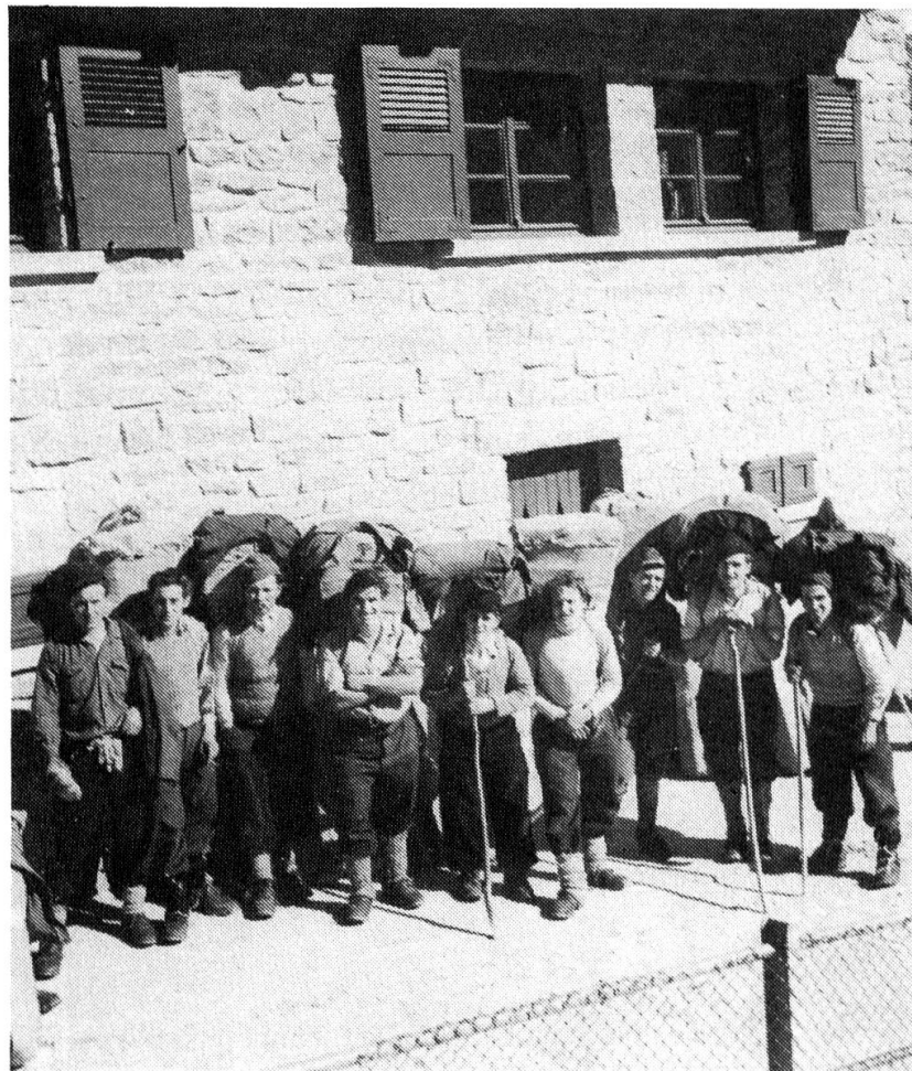
Schmuggler in Carena TI (März 1949)