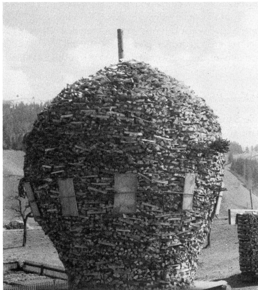
Kröschen- brunnen/Emmen- tal BE