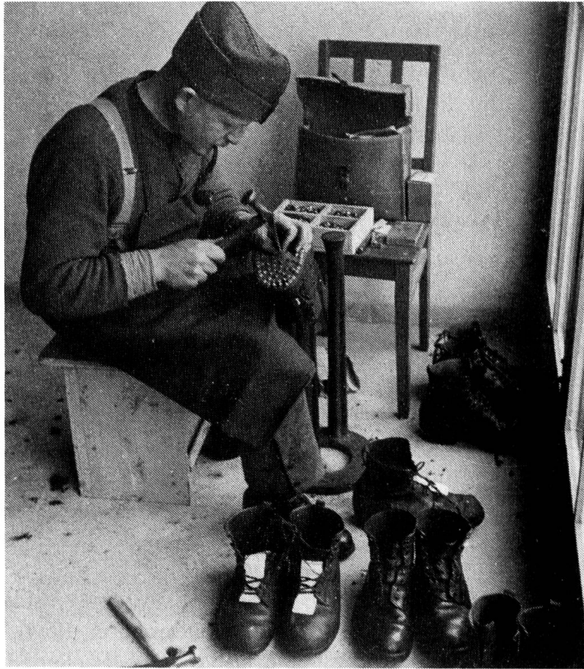
Militär- schuhmacher 1939-1945