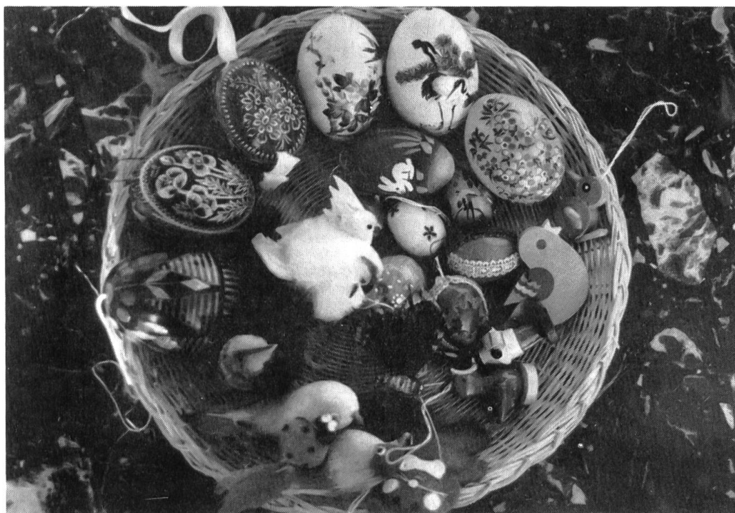
Käuflicher Schmuck für den Osterbaum. Aussen im Uhrzeigersinn, beginnend Mitte oben: Zwei bemalte Plastikeier aus China, ein Glasei, bemalte Holztiere, Stofftiere (Osterhase, Marienkäfer, Vögel), Lackei, zwei geritzte Hühnereier. In der Mitte ein bemaltes Hühnerei, bemalte und beklebte Holzeier sowie weitere Stofftiere.