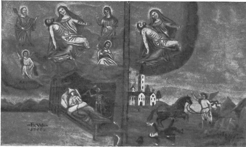
Ex-voto de 1756. Crêtél, comm. de Randogne (Valais).

Collection d'ex-voto de la Société suisse des traditions populaires.