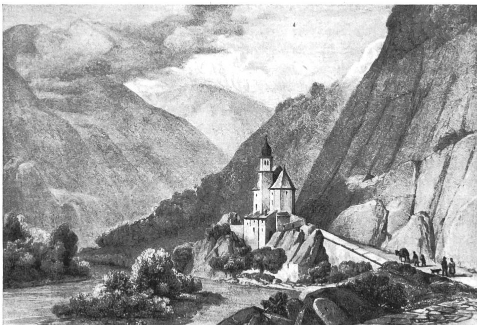
Chapelle de Hohenflue.

Lith. de Engelmann 1825 (coll. Bertrand).