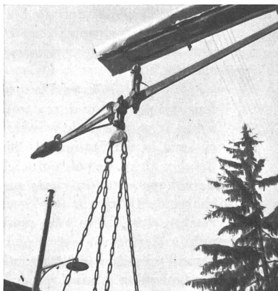
Fig. 3. La «tronche» et le fléau.