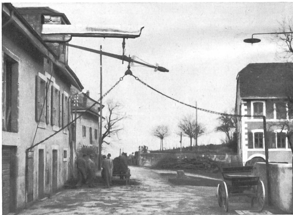
Fig. 2. La balance au repos.

On nous dit qu'elle est la dernière en Suisse à être utilisée. Dans le canton de Vaud, on se souvient d'en avoir vu à Lucens et à Chardonne; mais elles ont été supprimées depuis vingt ans au moins. Celle de Savuit fonctionnait autrefois à Lutry, à la Tour, où l'on voit encore sa porte, actuellement maçonnée. En 1868, un groupe de vigneron, constitué en société de quatre membres « peseurs » — actuellement sept — l'a achetée à la famille Gay pour le prix de 200 fr. La maison (fig. 1 et 2) est grevée d'une servitude en faveur du poids public. Les frais de la nouvelle installation à Savuit se montèrent à 750 fr. On compte bon an mal an une trentaine de pesées qui donnent un rendement d'environ 2 fr. par opération. Les frais d'entretien sont minimes, ils se réduisent à un graissage annuel.