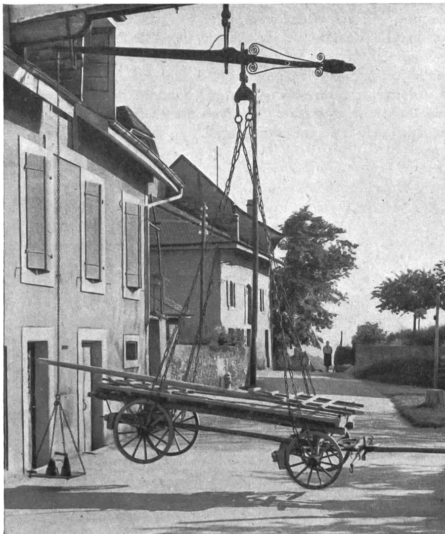
Fig. 1. La balance romaine de Savuit s. Lutry.