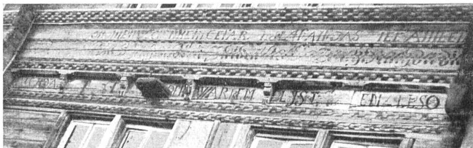
Façade sculptée d'une maison de Bönigen.