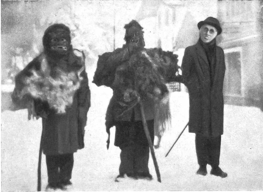
Fig. 6 – Deux masques anciens ... et un moderne.