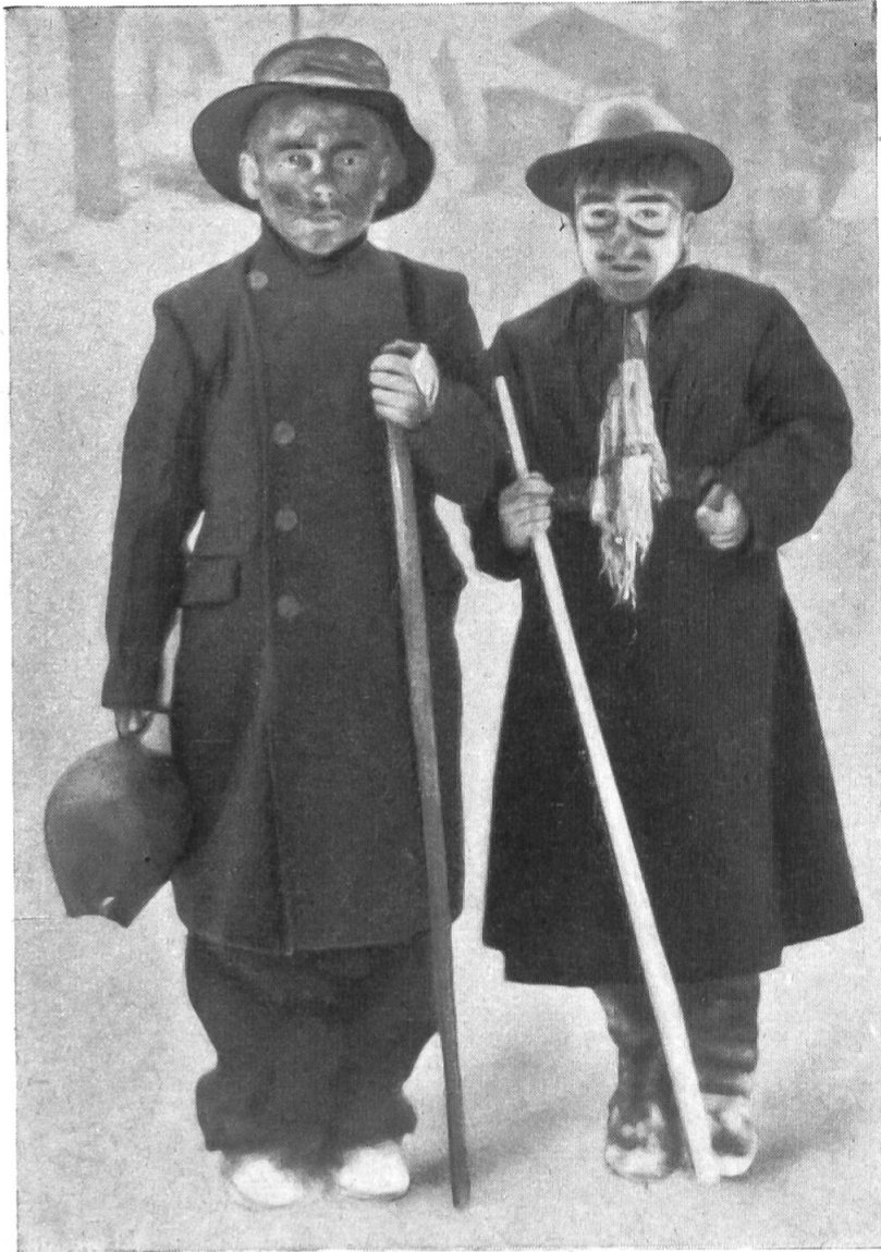
Fig. 5. – Deux masques valaisans.

Le soir venu, cette jeunesse se dépouille de ces hardes grotesques, soi-disant terrifiantes, pour revêtir de seyants costumes élégants, composés presque toujours de vestiges d'uniformes de l'Empire. Les déguisés s'en vont alors, jusque tard dans la nuit, rendre visite à leur dame de cœur, et, bien accueillis généralement dans les familles, boivent un café ou un verre de Fendant.