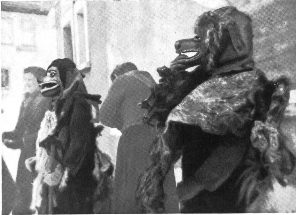
Fig. 3 – Deux masques typiques eux aussi.