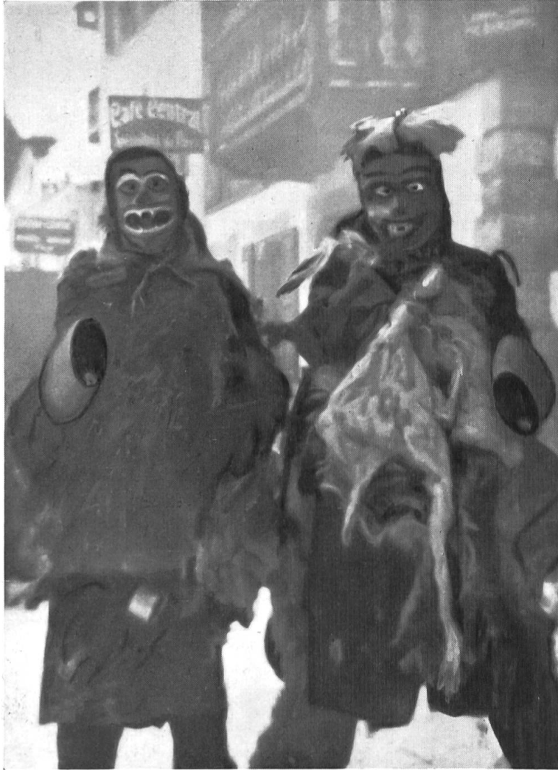
Fig. 2 – Deux masques anciens qui semblent plaire aux spectatrices.

Pendant cette période, des adolescents et de jeunes hommes respectent encore les traditions du passé. La journée, ils se revêtent de peaux de bêtes et se masquent de visagères sculptées dans le bois et peintes avec un goût certain. Têtes d'animaux, de monstres, voire même de diables sont les motifs préférés. Les déguisés tiennent souvent d'une main un gourdin, et de l'autre une cloche de vache secouée avec entrain.