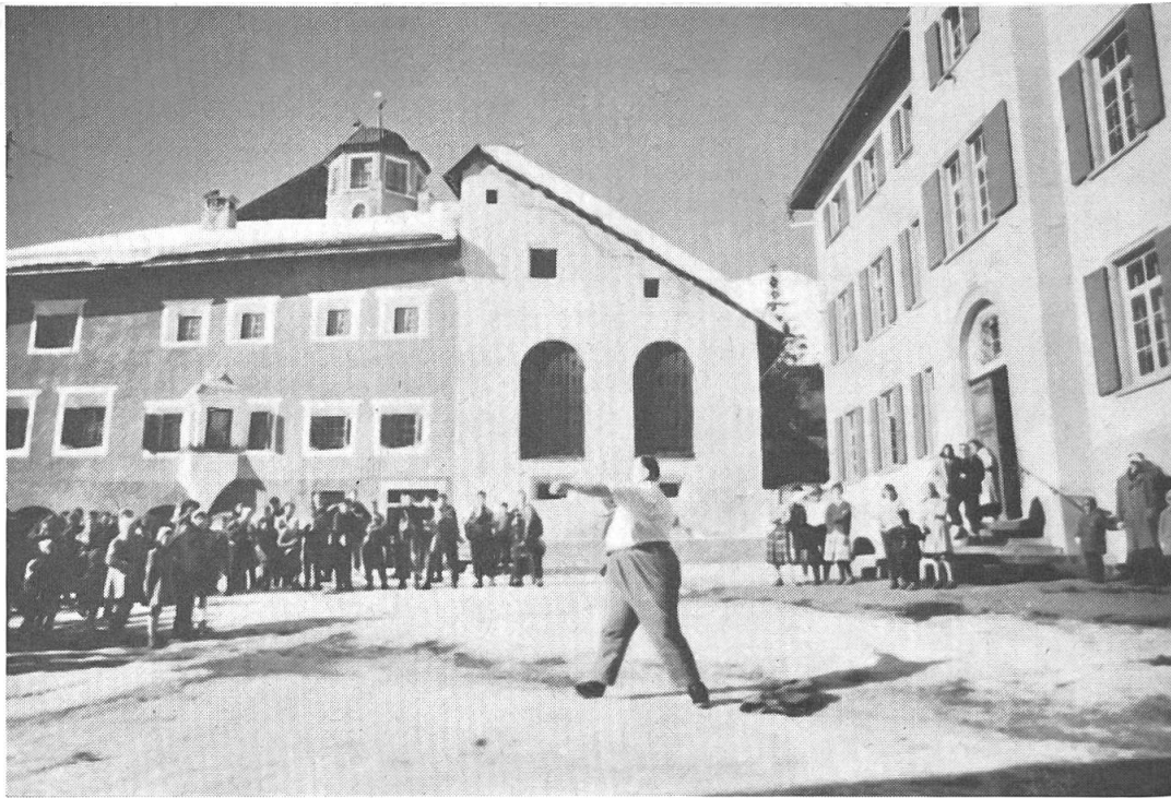
Fig. 3. Le claquement du fouet accompagne la sonnerie des cloches.

L'esprit magique et le sérieux militaire se sont nettement atténués dans «la Prova».