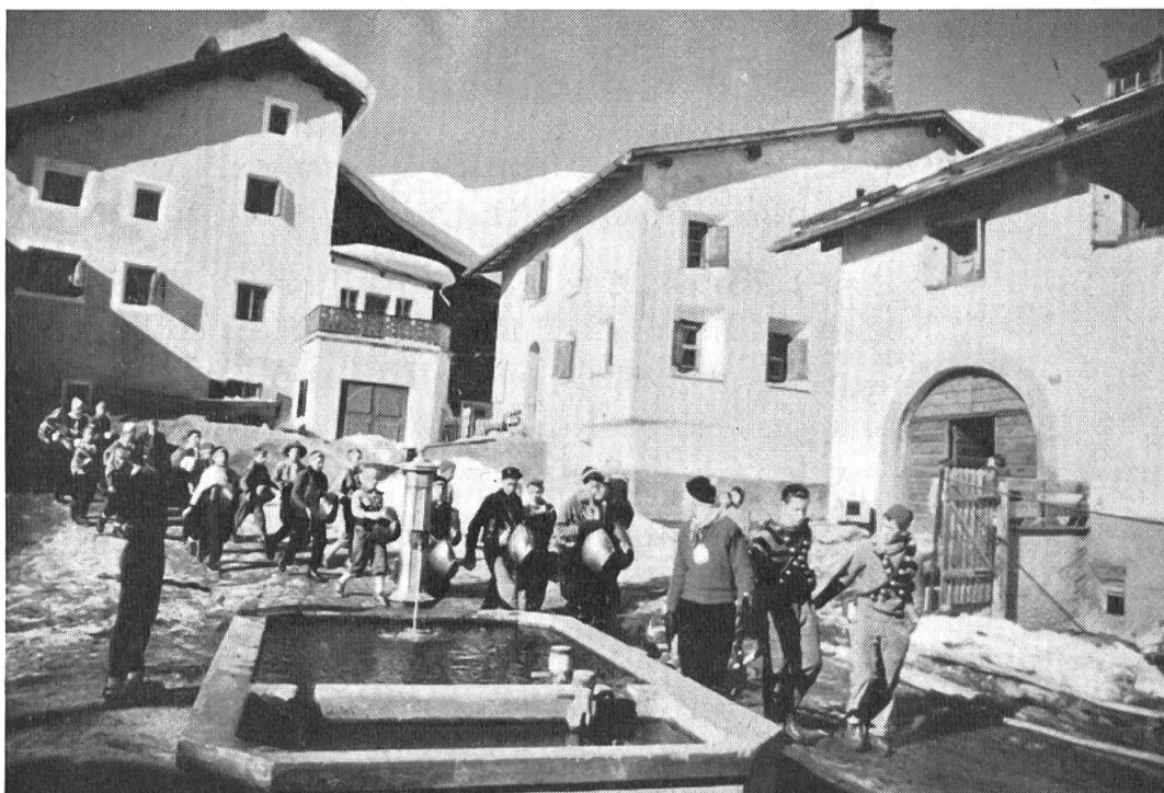
Fig. 1. Le cortège des cloches arrive à l'une des fontaines du village.

En tête, deux garçons plus âgés, porteurs d'un collier de grelots, tirent