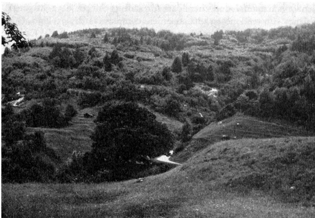
Veduta parziale del «Monte Grande»: in buona parte coperto da bosco (abete rosso e betulle). Trent'anni fa le zone chiare (betulle) erano quasi tutte prative.

Attualmente si sta forse eccedendo in senso opposto con molti rimboschimenti. Ciò è dovuto non solo all'efficienza del ramo forestale e dei suoi competenti rappresentanti, bensì anche al lento ma continuo cambiamento del tipo di economia di Soazza. Quando si pensa che ancora dopo la prima guerra mondiale c'erano a Soazza da 800 a 1000 capre e sene vede il ridottissimo numero attuale si capisce facilmente il cambiamento. Resta che boschi e legname, a Soazza, saranno sempre un argomento importante.