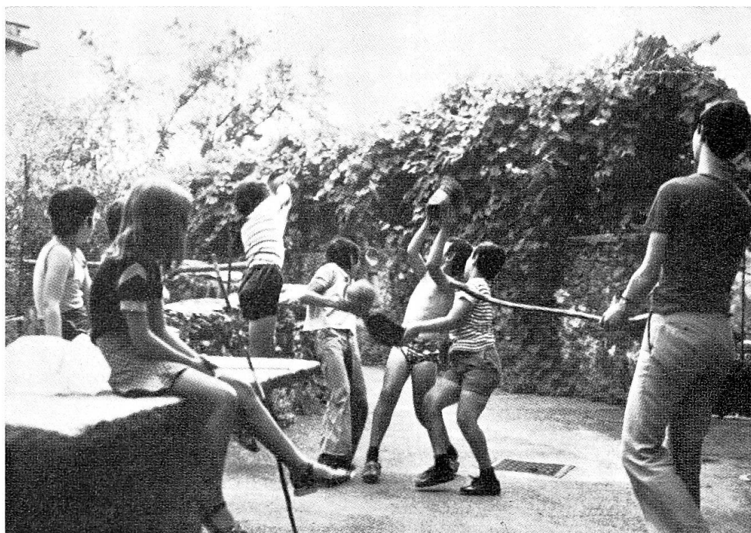
La lipa , come viene chiamato in gran parte del canton Ticino. Questo giuoco comunitario che i ragazzi di Camorino dicevano cilü?... píu! in una recente foto.

La lite generalmente era dovuta alla contestazione di un fallo, a una potente stangata che aveva lasciato il segno, alla perdita di un cilü particolarmente caro che era rimasto oltre la gronda.