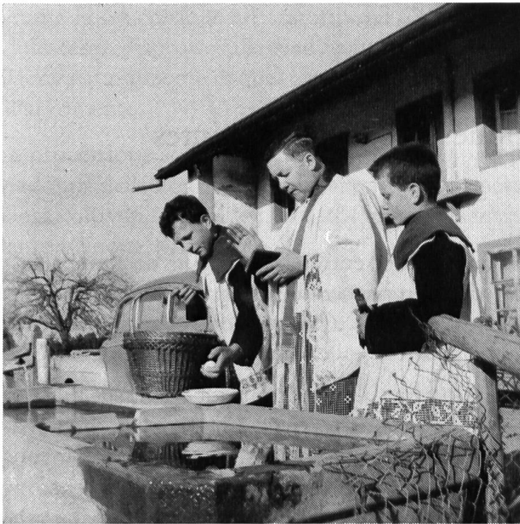
Bénédictio de l'eau de la fontaine.

tions sur les biens de la terre, et de lui recommander tous nos besoins spirituels et corporels.»