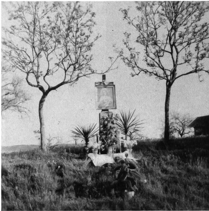
Entre deux arbres, une croix au bord du chemin, ornée de fleurs et d'une image du Sacré-Cœur.