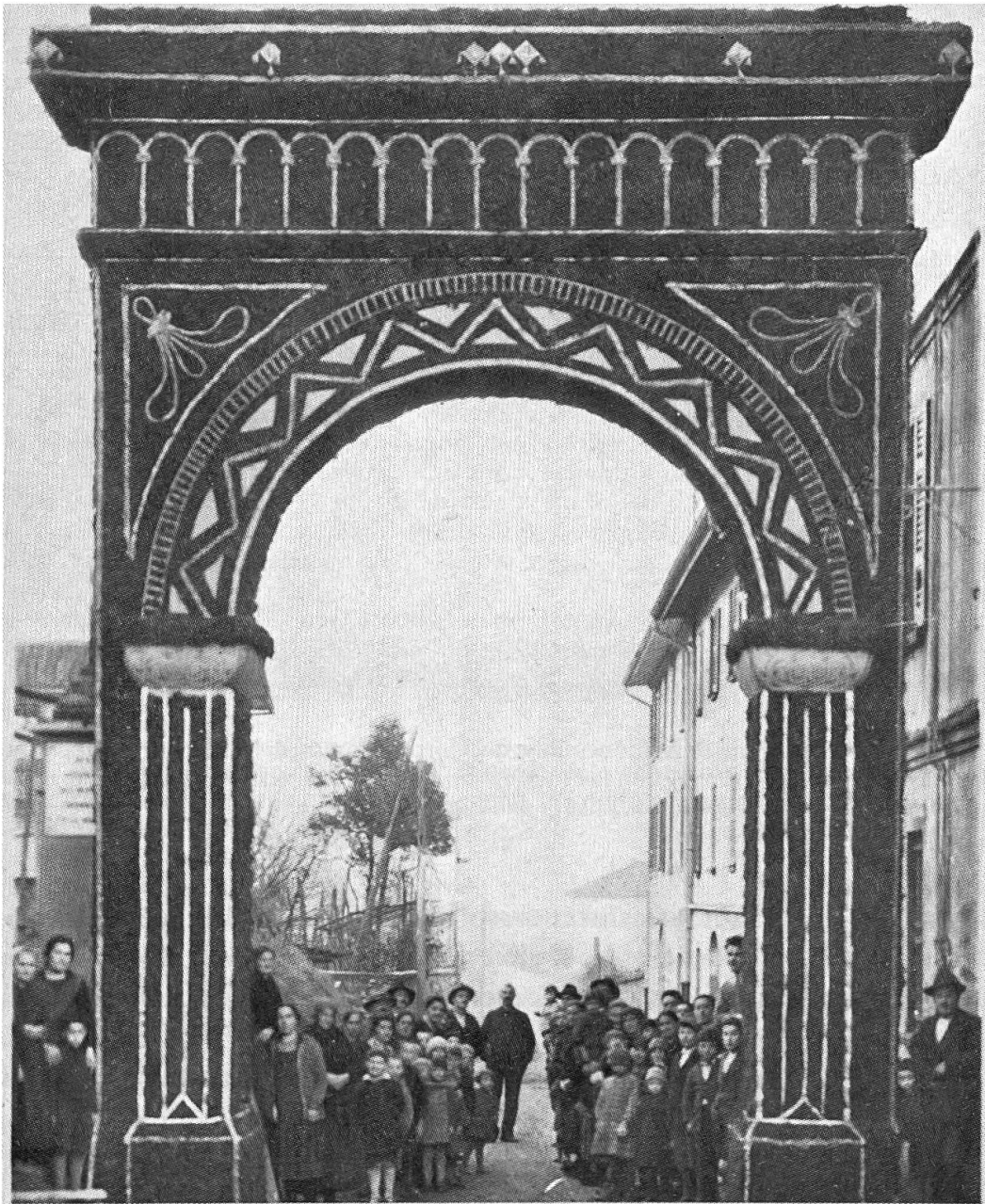
Fig. 3. Porta trionfale artistica per la processione di San Giuseppe a Ligornetto (1930) (da: Celebrazioni cinquantenarie in onore di San Giuseppe - Ligornetto marzo-giugno 1980, p. 66).

altarini nei passaggi più spaziosi e sulle piazzette, addobbandoli con drappi e fiori ed esponendovi immagini o statue sacre. A Magliaso, a Davesco-Soragno, a Morbio Inferiore si vedevano anche qua e là quadri viventi impersonati da bambini; a Mendrisio perfino degli affreschi prospettici. A metà percorso, di solito, la parrocchia poneva un altare più grande (nei borghi perfino due o tre) per la sosta della benedizione con la reliquia. Il celebrante la reggeva coi lembi della stola più ricca posseduta dalla chiesa. Gli altari potevano anche essere a baldacchino o a capanna (Magliaso, Melide).