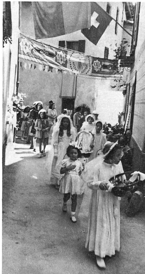
Fig. 4 Le «verginnelle» della processione del Corpus Domini a Melide (1942).

In occasione del Corpus Domini si vedevano esposte lungo il percorso sulle pareti delle case, alle finestre e su corde tirate fra pianta e pianta le lenzuola di lino ricamate dei preziosi corredi delle spose che venivano tolte per l'occasione dalle cassapanche e dai comò. Nel 1500 si alternavano anche coperte gialle di filaticcio di seta. In Valle di Muggio si esponevano le magnifiche coperte di lino tessute in casa a strette strisce. Esse venivano cucite assieme, tinte con colori naturali estratti prevalentemente da piante e poi impresse con stampi intagliati di legno e anche muniti di punte di ferro per formare meravigliose decorazioni floreali in tinte contrastanti 1 . Questi tessuti nostrani furono soppiantati da quelli a fattura meccanica. I preziosi manufatti muliebri nelle processioni furono sostituiti con bandiere alle finestre e file di bandierine multicolori cucite lungo una cordicella. Resisterono 2 le lunghe sandaline 3 , cioè i drappi tesi orizzontalmente in alto attraverso il percorso, sopra il passaggio degli oranti; alcune venivano anche appese verticalmente a lunghi pali (Ligornetto). Queste (rosse, bianche, gialle, spesso bicolori) potevano anche essere frangiate in giallo oro. I benestanti vi facevano perfino dipingere immagini religiose da pittori locali. I portali delle chiese venivano anche addobbati con drappi rossi frangiate (Muggio, Mendrisio). Non mancavano i devoti che allestivano