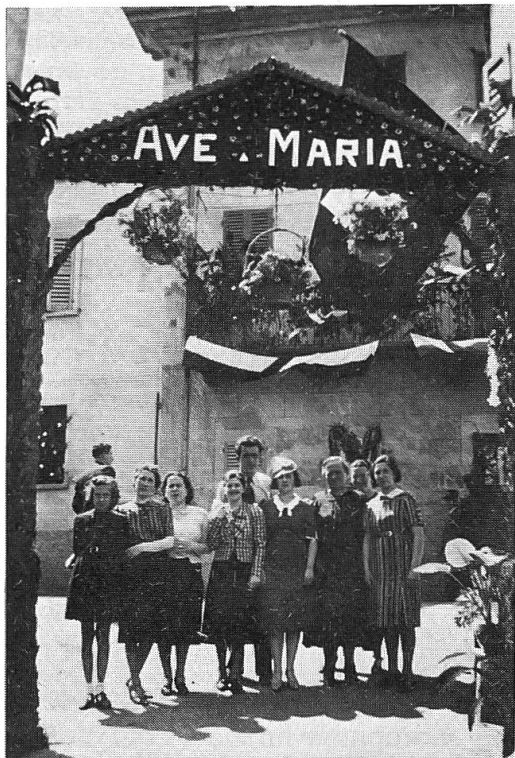
Fig. 2. Porta trionfale rustica a Melide (maggio 1939).