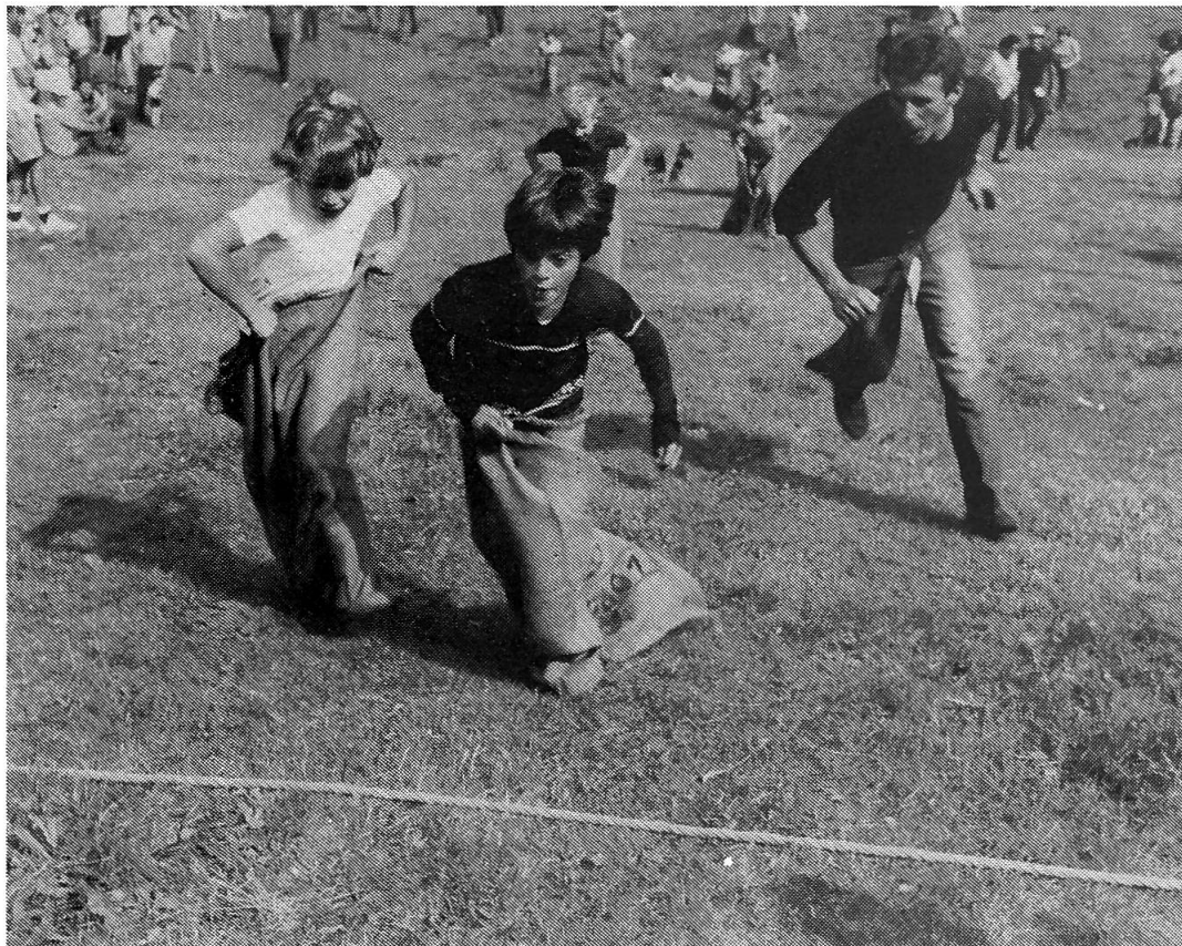
La course aux sacs à Avise