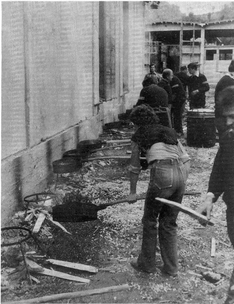
Castagnata à Avise