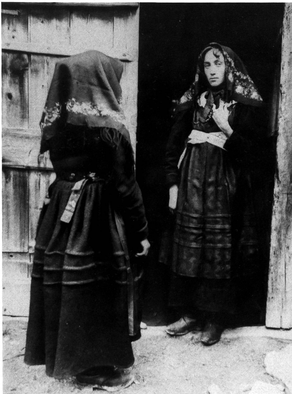
Cogne (début du XX e siècle) – Costume de fête.

Le tablier ( lo fôdé ) est en toile de chanvre, teint en bleu au vitriol, amidonné et ciré à l'aide d'une préparation à base de campêche. La bavette ( lo braveillon ), assuré sous le col par des épingle et par une chaînette en laiton, recouvre le plastron du goné ; la partie inférieure est normalement repliée et