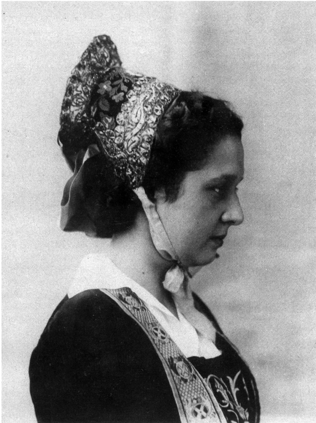
Gressoney (vers 1930/40) – Coiffe du type «Goldene Chappo».

blement du développement d'un couvre-chef remarqué par Schott lors de son séjour: un «chapeau» noir décoré de rayons brodés à partir d'un bouton central 12 . Cette description n'est pas extrêmement claire, mais elle se rapporte vraisemblablement à la coiffe ( Zecco ) qui apparaît dans une peinture de 1850 représentant une dame âgée, et dont il reste des exemplaires, richement brodés en soie et en or, chez des particuliers de l'endroit 13 .