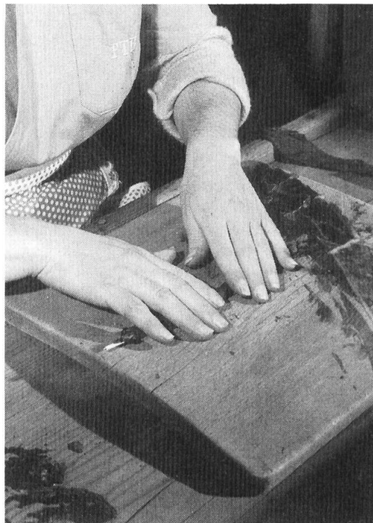
Fig. 6. Arrotolatura: si noti la «cannuccia» sporgente.