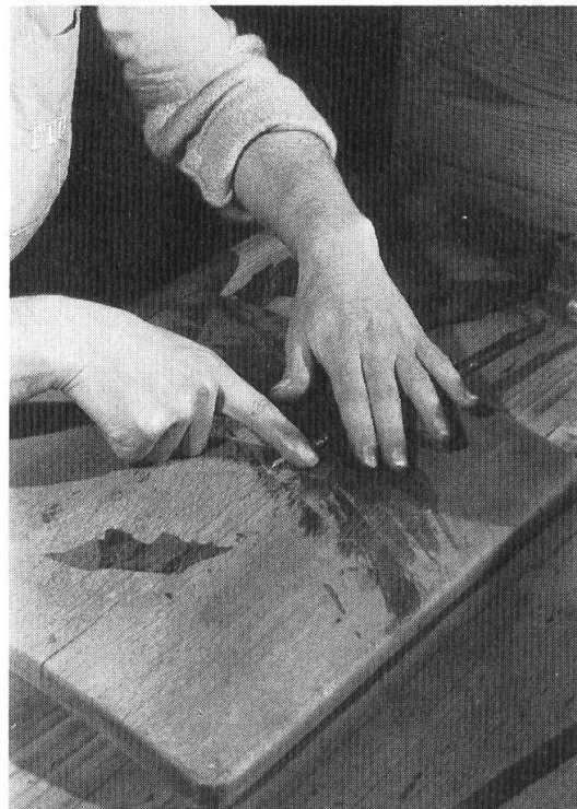
Fig. 8. Assestamento del bocchino.