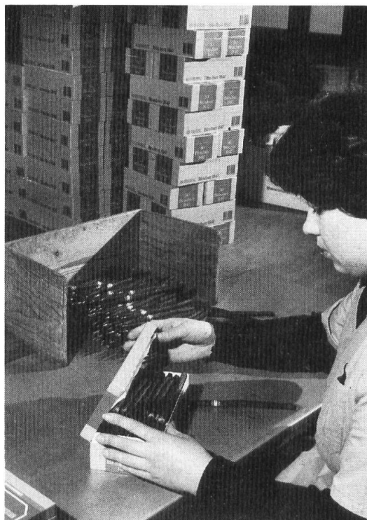
Fig. 11. Imballaggio.