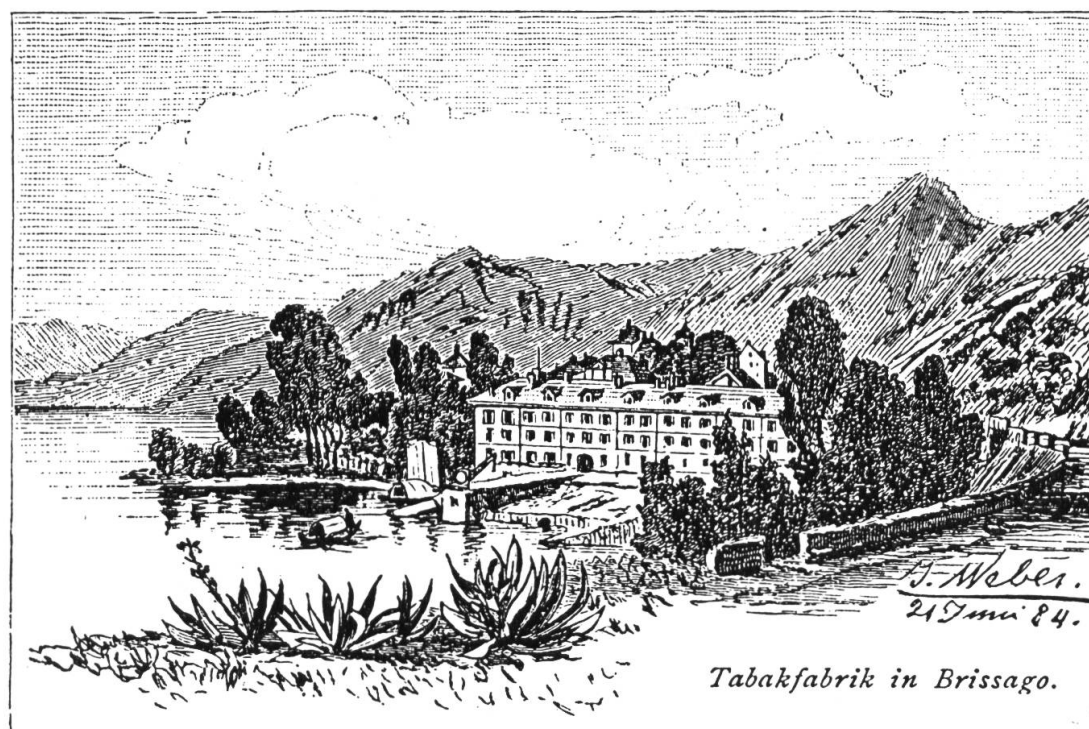
Fig. 12. La Fabbrica Tabacchi Brissago in una silografia, da un disegno di J. Weber, 1884.

(Traduzione della Red. del testo apparso in Schweizer Volkskunde 68 (1988), p. 17–27.)