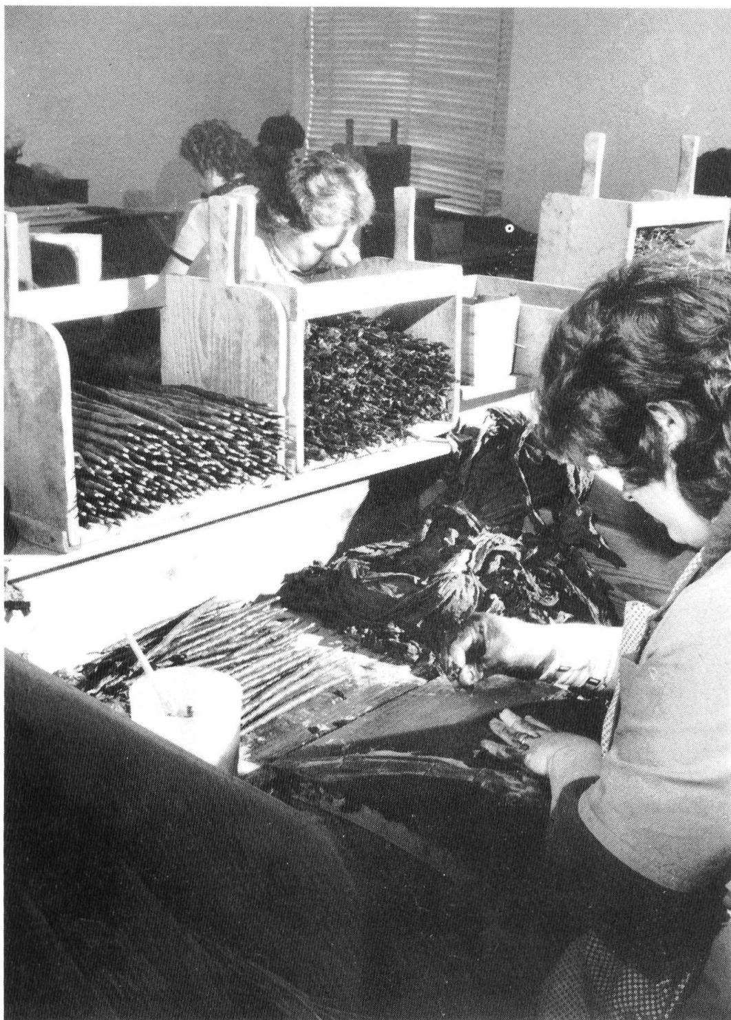
Fig. 4. Il posto di lavoro della sigaraia: a sinistra il recipiente di plastica con la «concia».

nese e che ripassano a prenderle la sera; altre vengono a lavorare con la corriera. Capita che in un locale della fabbrica madre e figlia lavorino allo stesso tavolo a cui un tempo lavorava la nonna. Per un certo periodo la fabbrica ebbe perfino il proprio asilo d'infanzia.