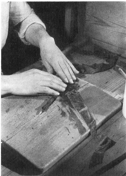
Fig. 7. Arrotolatura.

Al posto di lavoro di una sigaraia. – Il «brissago» è composto di un «interno» di tabacco virginia e kentucky, avvolto in una «sottofascia» di kentucky, e in una «coperta» di virginia, che gli permette la denominazione di qualità «Virginia». Prima dell'arrotolatura, sulla «coperta» è spalmata una «concia» consistente in una colla di amido di frumento, di vino bianco di Valencia e di altri ingredienti di cui si serba il segreto. Nell'arrotolare l'«interno» la sigaraia munisce inoltre il sigaro nascente di un corto stelo di paglia di cereale italiana («cannuccia») e dello stelo di erba alfa spagnola («paglia») che vi è infilato. La «cannuccia» funge da bocchino, la «paglia», che viene estratta prima dell'accensione del sigaro, lo provvede di un canaletto