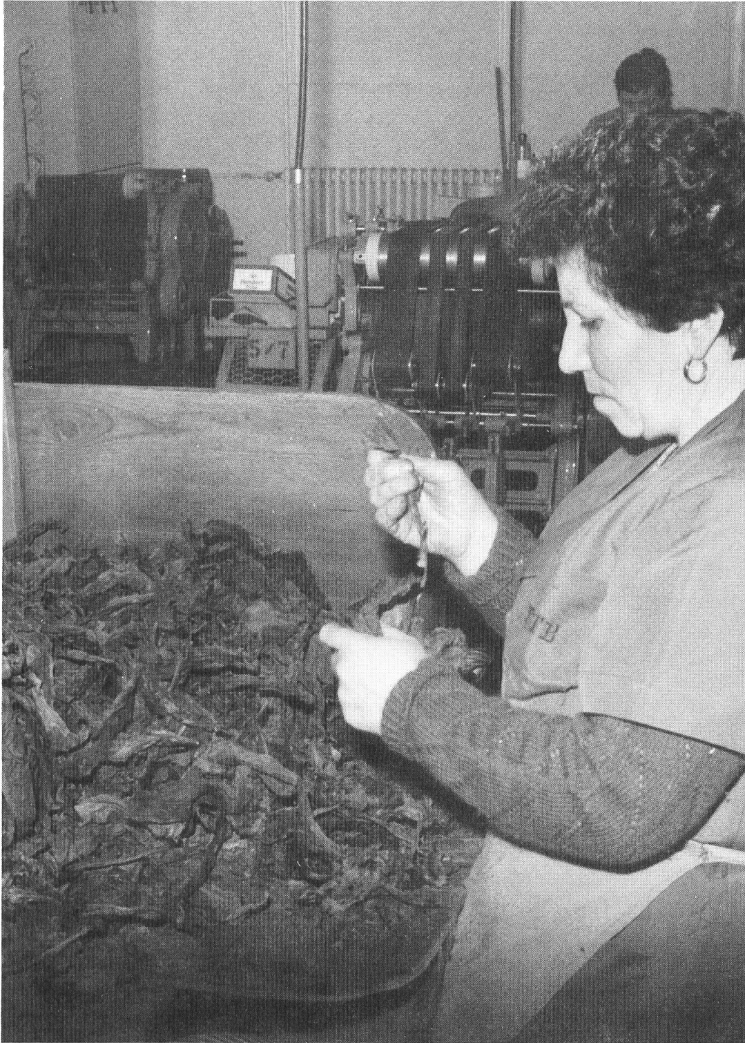
Fig. 1. La scostolatura manuale.