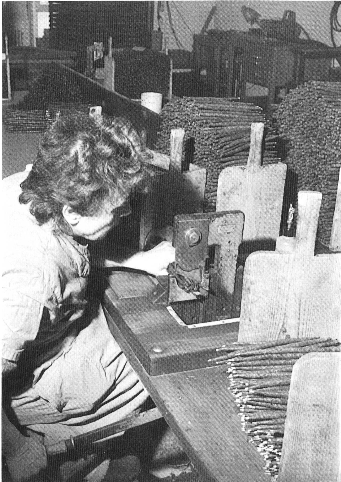
Fig. 9. Taglio dei sigari con la ghigliottina.

La cimatura. – Ogni tipo di sigaro ha una precisa lunghezza. I «brissago» ricevono ora la loro lunghezza prestabilita di 21 cm. A questo scopo ven-