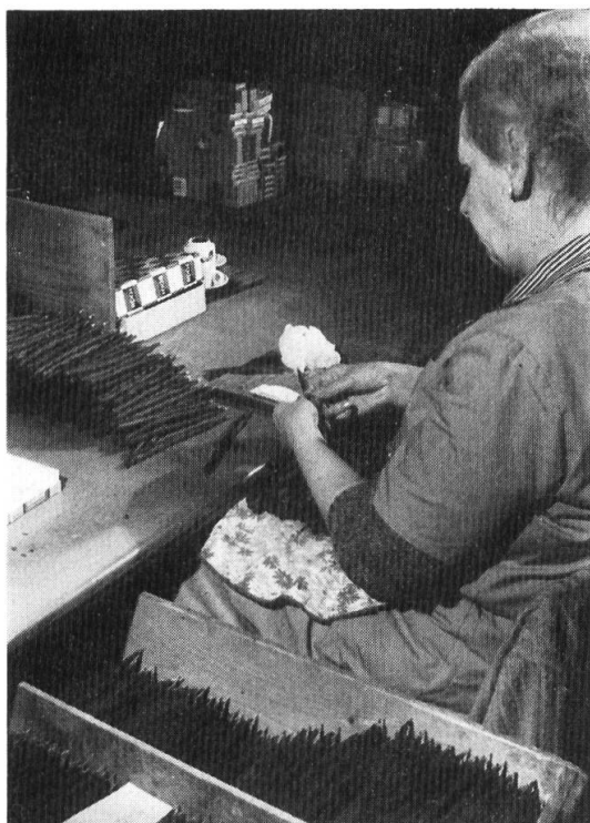
Fig. 10. Inanellatura.

Immagazzinamento. – Dopo la fabbricazione i sigari sono come il vino o il formaggio giovani: devono stagionare e maturare. Occorrono tre mesi perché acquistino l'aroma richiesto dai futuri fumatori.