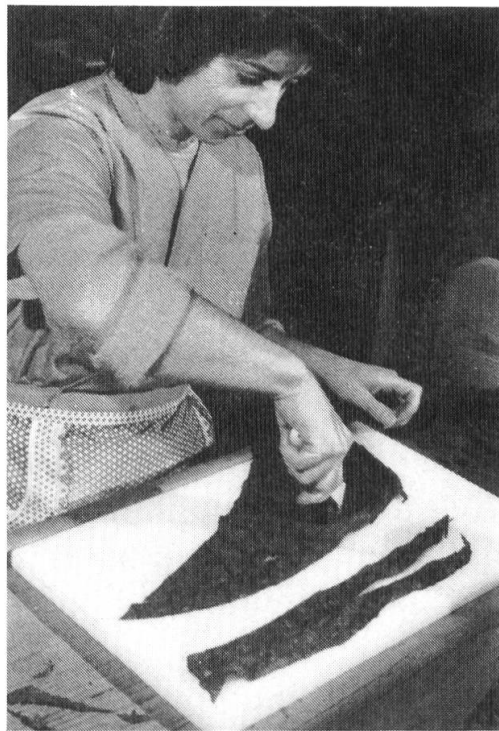
Fig. 3. Taglio della «sottofascia» o della «coperta» con la «rotella».