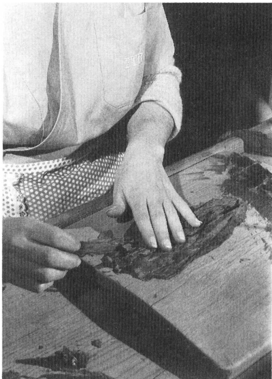
Fig. 5. Preparazione delle foglie dell'«interno».

La scostolatura. Contrariamente al tabacco destinato ai «toscani», quello di un «brissago» non è fatto fermentare. Con un breve bagno ci si limita unicamente a restituirgli una parte dell'umidità che gli è stata tolta dal produt-