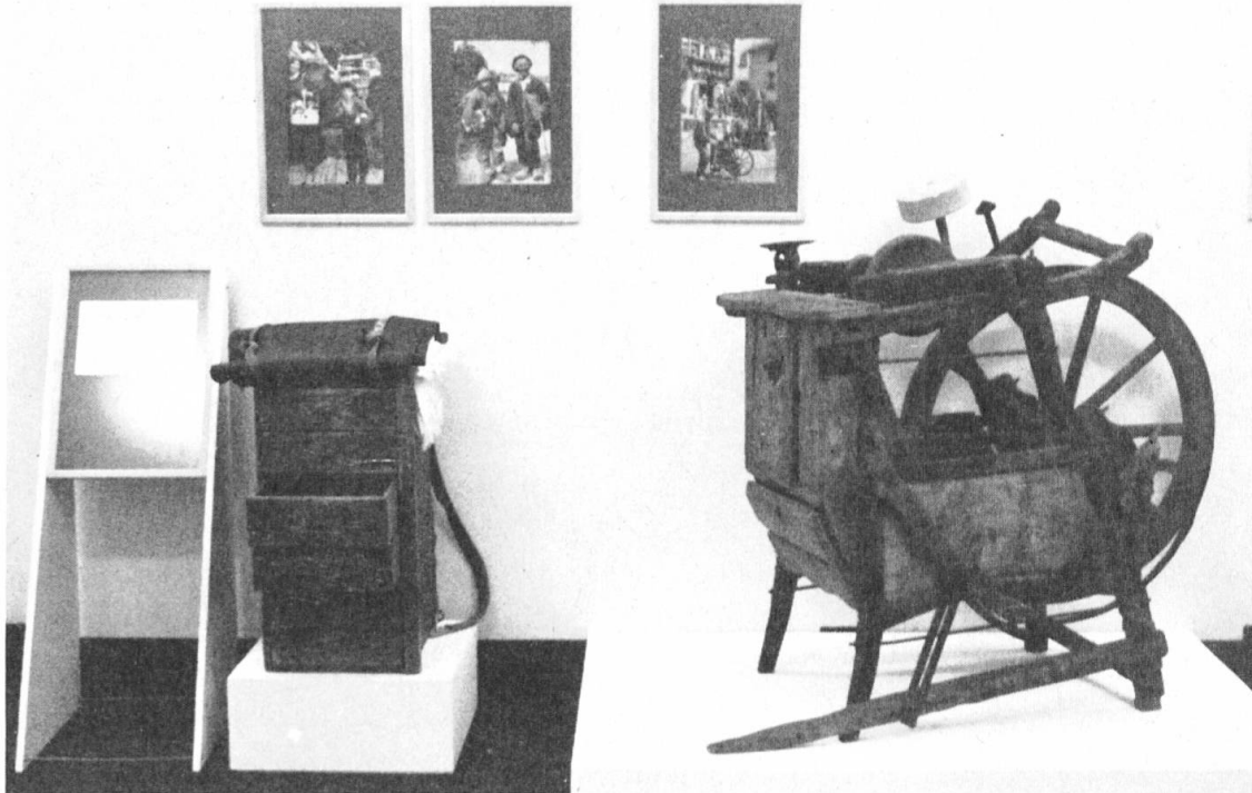
Fig. 2 Professioni girovaghe

Tutta la storia dei rapporti fra le comunità del mondo alpino e i centri popolosi nelle pianure è caratterizzata da questi scambi e da prestazioni di lavoro di artigiani, operai, contadini, ecc.