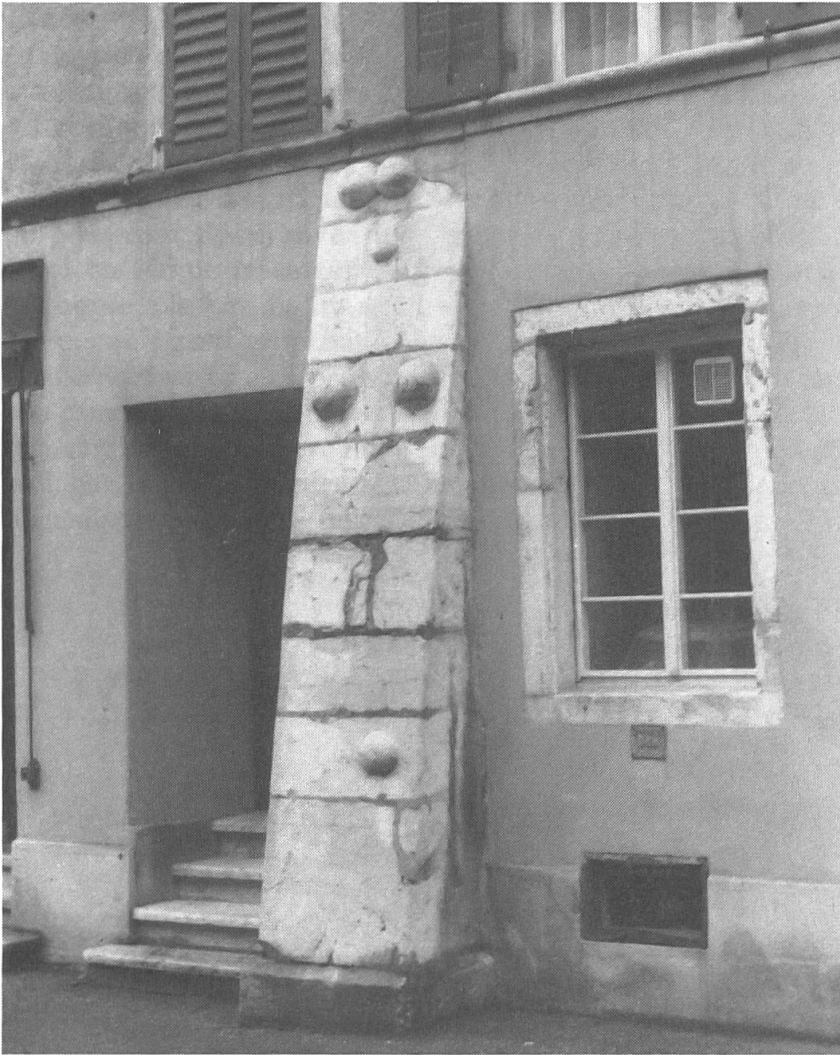
Fig. 3. Boules apotropaïques dans la vieille ville de Bienne. On en ignore la signification.