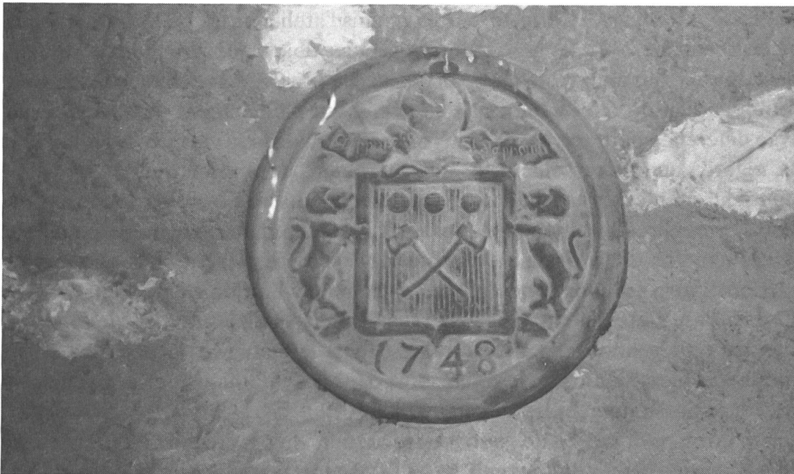
Fig. 4. Les haches croisées des charpentiers sont devenues meubles du blason des Chappuis à St-Saphorin.