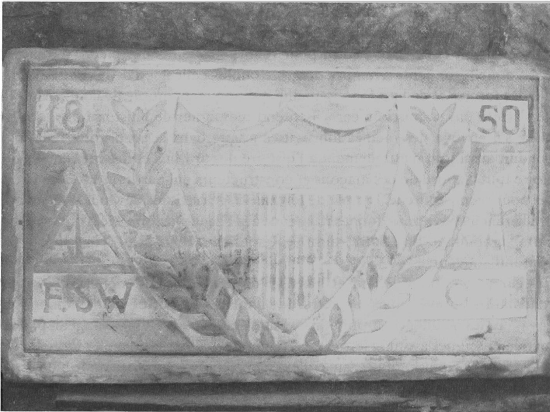
Fig. 1. Emblème en molasse, à Chailly sur Lausanne. Maçon ou franc-maçon?.