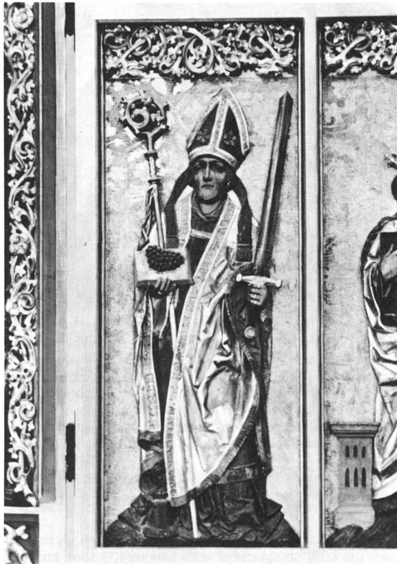
Fig. 2: Bas-relief gothique tardif (vers 1500) en bois polychromé et doré, provenant de Schmidigehisclere (Bas-Conches), aujourd'hui intégré au volet droit du retable du maître-autel de la cathédrale de Sion: saint Théodule, patron du diocèse et vraisemblablement premier évêque d'Octodure (Martigny) à la fin du 4 e siècle, représenté avec tous ses attributs traditionnels. Outre la mitre et la crosse de l'évêque, le glaive évoque les droits régaliens, soit le pouvoir temporel conféré à Théodule, selon la légende, par Charlemagne. A ses pieds, la cloche avec le diable qui, d'après une autre légende, l'aurait apportée de Rome en Valais. Enfin, de la même main que la crosse, le saint évêque tient un livre ouvert, sur lequel est posée une grappe, évoquant une troisième légende, celle de la conversion en fin nectar d'une infâme piquette, par l'intercession du prélat. Relativement rare, moins fréquente en tout cas que la cloche et l'épée, pour ainsi dire toujours associées à Théodule, la représentation ou le rappel du miracle du vin devait cependant être cher aux vignerons valaisans du Moyen Age.