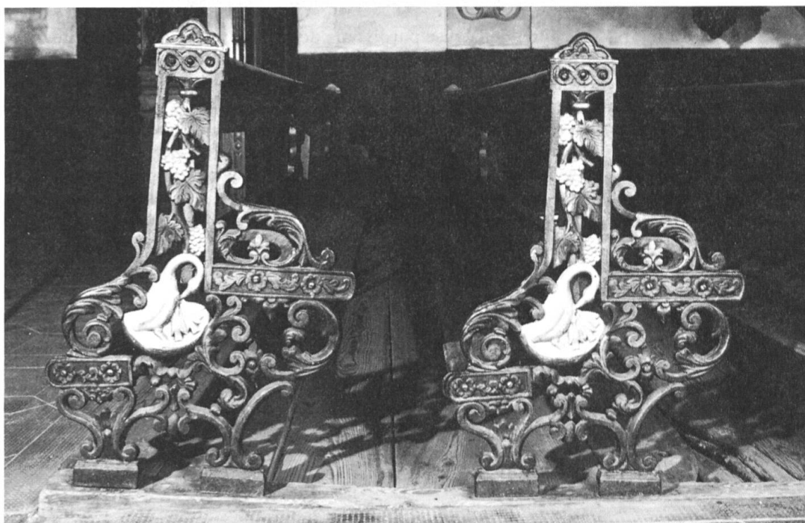
Fig. 9: Têtes de bancs ou jouées de l'ancienne église de Mase (district d'Hérens), fonte (d'Ardon?) de 1913 environ: au-dessus du symbole du sacrifice du Christ que rappelle le pélican s'ouvrant les entrailles (pour nourrir ses petits), cep avec feuilles de vigne et grappes de raisin sont censés évoquer le sang du Christ de la transsubstantiation opérée au cours de l'Office divin autant que l'omniprésente culture de la vigne dans la Bible (Photo Office des monuments d'art et d'histoire, Jean-Marc Biner, Bramois).