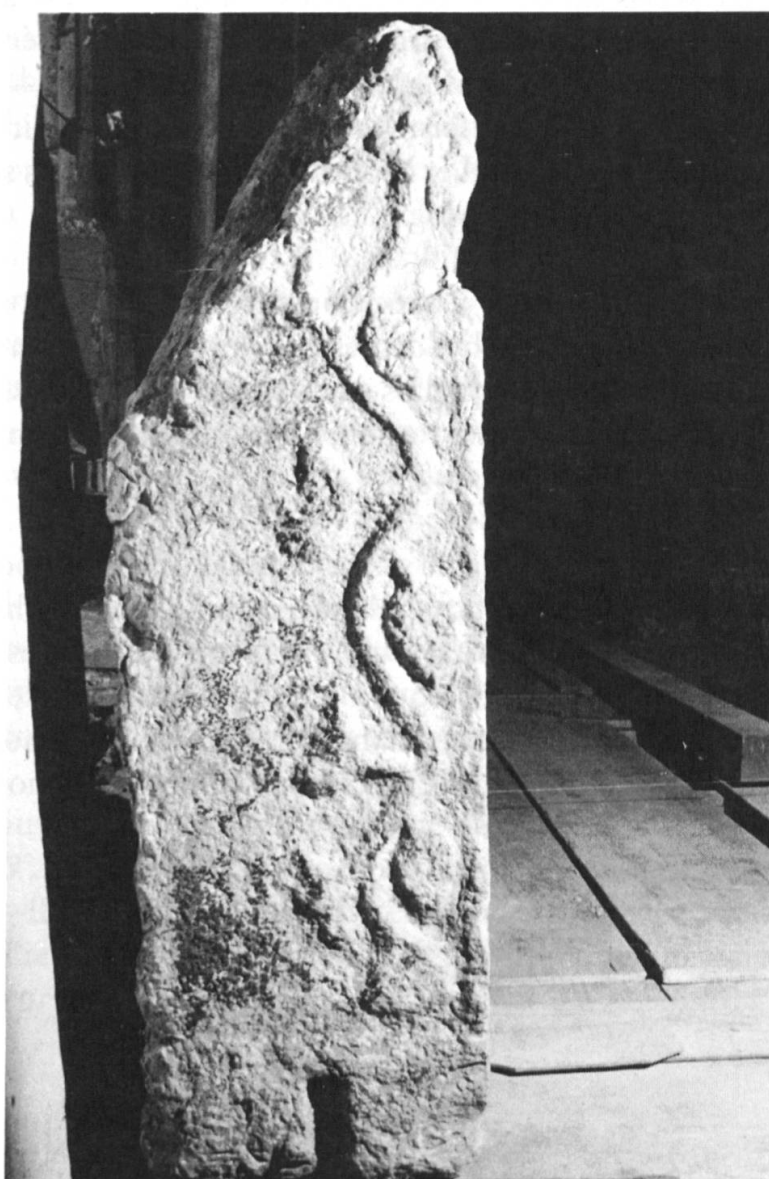
Fig. 1: Stèle funéraire d'un soldat romain et de son épouse, du 3 e siècle après J.-C., retrouvée lors des fouilles de l'église paroissiale de Martigny (1990–1992): petit côté gauche, montrant un cep ondulé auquel pendent des grappes de raisin, probablement à ce jour la plus ancienne représentation de vigne exécutée en Valais.