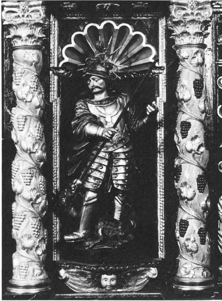
Fig. 7: Détail du retable de l'autel de l'église paroissiale de Miège, niche latérale droite, avec saint Georges terrassant le dragon, entre deux colonnes torsées ornées de ceps avec feuilles de vigne et grappes de raisin, vers 1700. Motif courant de la décoration des colonnes torsées à l'ère baroque, les pampres ne sont ni plus fréquents ni plus rares en Valais que dans d'autres régions. Si elle ne peut être toujours fortuite, leur apparition n'est pas obligatoirement liée dans chaque cas à la culture de la vigne dans le pays. Il demeure toutefois exceptionnel que des éléments voisins, tels ceux de Miège, soient décorés tous deux (tous quatre en tenant compte de la niche correspondante à gauche), de ce même ornement. Mais ose-t-on pour autant invoquer la culture viti-vinicole des lieux, moins exclusive à l'époque que de nos jours? (Photo Office des monuments d'art et d'histoire, Jean-Marc Biner, Bramois).