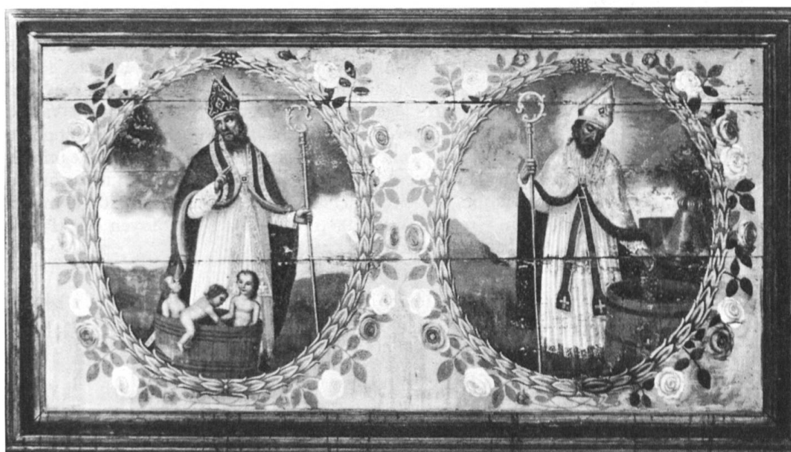
Fig. 5: Devant d'autel de la chapelle de Commeire (commune d'Orsières), peinture sur bois, vers 1800: à gauche saint Nicolas, à droite saint Théodule, en évêque mitré et crossé, laissant tomber une grappe dans une cuve (? ou tonneau), une cloche à l'arrière-plan pour confirmer l'identification.