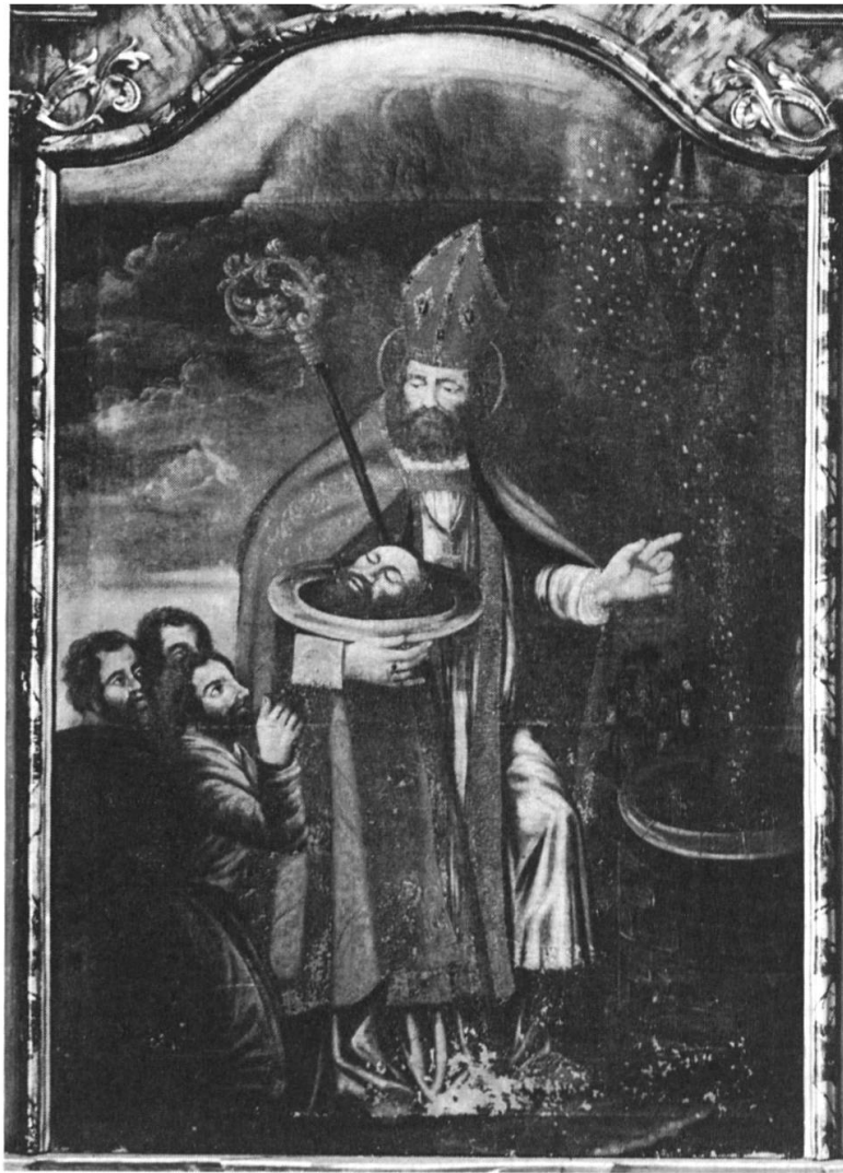
Fig. 6: Couronnement du retable de l'autel latéral droit de l'église paroissiale de Montanavillage, huile sur toile, fin du 18e siècle: saint Grat, patron d'Aoste et de la chapelle de Montana sous l'Ancien Régime déjà, rarement invoqué en Valais par ailleurs, est représenté en évêque, portant sur un plat la tête de saint Jean-Baptiste qu'il aurait offerte au pape; trois personnages, à gauche, l'implorent à genoux, tandis qu'il écarte, d'un geste de bénédiction, la grêle menaçant la vigne – symbolisée par une treille – pour l'expédier directement dans un puits, avec le démon qui l'a provoquée (Photo Office des monuments d'art et d'histoire, Bernard Dubuis, Sion).