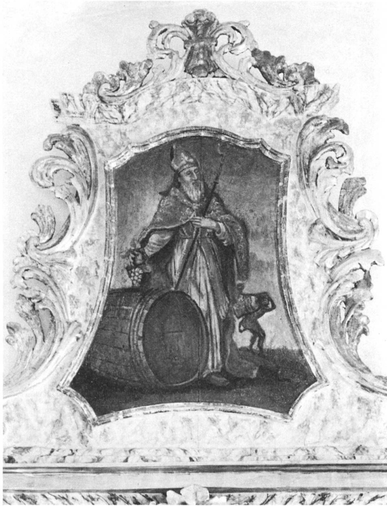
Fig. 4: Couronnement du retable de l'ancienne chapelle de Corin sur Sierre (commune de Montana), peinture sur toile (?): comme dans le retable de 1600 environ, saint Théodule introduit dans un tonneau une grappe de raisin. Mitré et crossé, il est accompagné du petit diable portant la cloche. 1764 environ (Photo Office des monuments d'art et d'histoire, Bernard Dubuis, Sion).