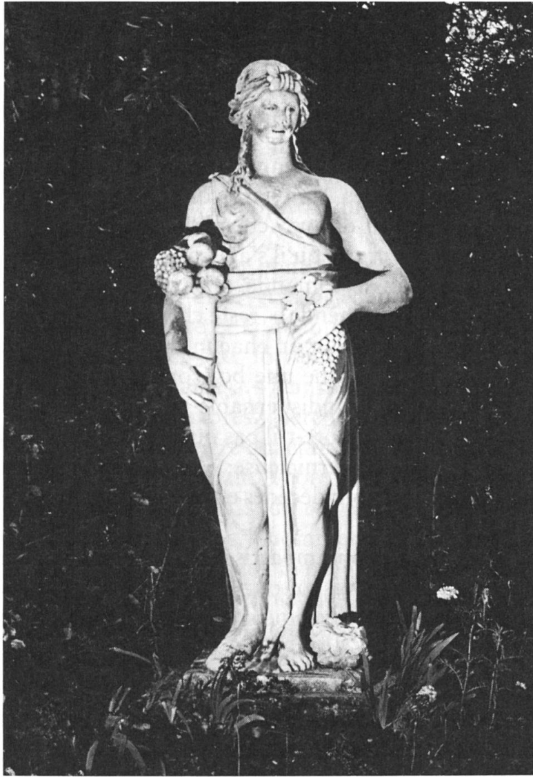
Fig. 10: L'automne, une des quatre statues symbolisant les saisons dans le jardin de l'ancienne maison de Werra, à Loèche-Ville, vers 1810: faut-il prêter à sa destination valaisanne le fait que cette sculpture accorde, parmi les fruits de «sa saison», une place prépondérante au raisin?