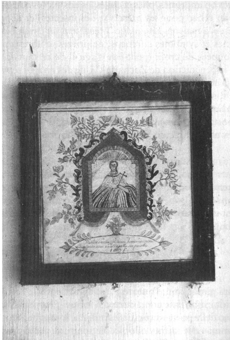
Fig. 3: Image de sainte Agathe. Dessin aquarellé daté de 1836. Montfaucon, Le Pêché.

Dans un article publié en 1952 dans Folklore suisse , Jules Surdez signale que ces images étaient imprimées à Delle et qu'elles étaient vendues dans la région par des colporteurs alsaciens. Il précise plus loin que «dans maintes paroisses de l'Ajoie, on apposait à côté des <Sainte-Agathe> des images de Saint Vendelin, pour préserver le bétail, les chevaux surtout, de toute maladie.» 8