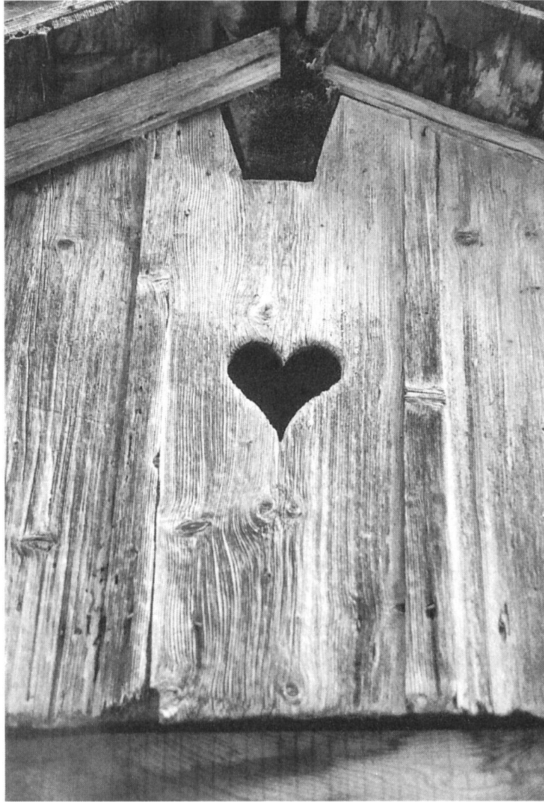
Fig. 2: Jour en forme de cœur, motif fréquent du décor paysan. Le Noirmont, Les Esserts.

éléments en forme de corne évoquant l'aspect et le mouvement d'une hélice. Bien qu'on ne puisse pas l'expliquer, on ne peut s'empêcher d'évoquer aussi la parenté formelle de ce motif avec le symbole taoïste du yin et du yang.