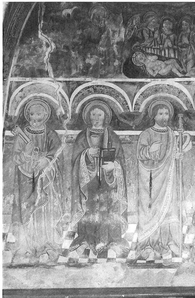
I santi Pietro, Giovanni e Giacomo Maggiore nella parete nord.

Le immagini dei dodici apostoli sono nell'abside tardo-gotica a pianta quadrata della chiesa (di origine romanica ma a più riprese riattata), i cui affreschi, di impianto ancora in parte romanico e di gusto popolare, sono datati settembre 1511, ma non firmati. 2 I santi sono riconoscibili, oltre che per i tradizionali attributi, 3 per la presenza di didascalie con il nome in latino. Pietro, Giovanni, Giacomo Maggiore, Andrea, Matteo, Giacomo