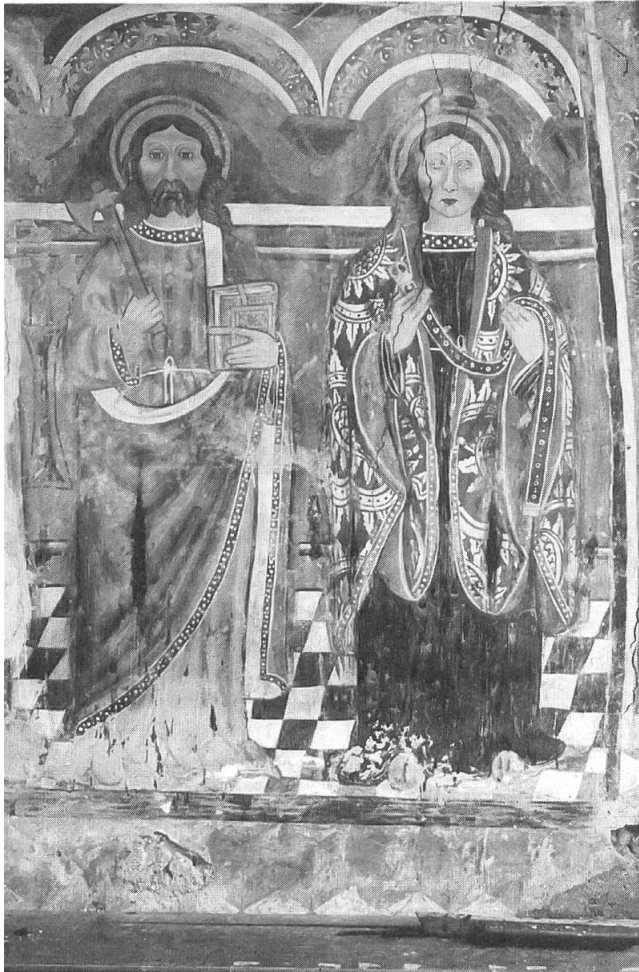
I santi Filippo e Tommaso nella parete sud.

Minore sono raffigurati nella parete nord; Bartolomeo, Simone, Taddeo (le immagini degli ultimi due sono scomparse per l'apertura di una finestra ma restano le didascalie con i nomi), Filippo, Tommaso, Mattia nella parete sud.