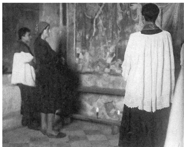
Le candele disposte di fronte ai sei apostoli della parete nord. (Disegno di Ovini, FS, anno 40, 1950, p. 10.)