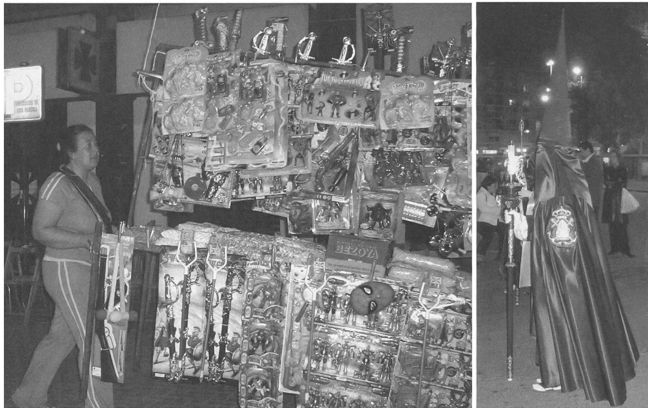
Bevor die Prozession durch die Gassen zieht: mit Süßigkeiten und Spielsachen beladener Wagen. Zu kaufen gibt es auch bunte Nazarenos aus Zucker. Prozession in Cartagena