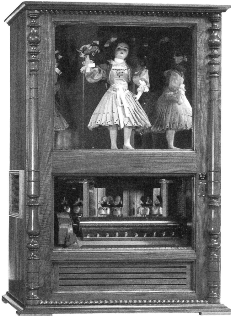
Zweigeschossiger Bahnhof-Musikautomat aus dem Bahnhof Nyon VD, ca. 1890.

Die Allgemeine Objektsammlung umfasst rund 1500 Objekte. Einen Schwerpunkt bilden die Bahnlaternen mit über 300 Beleuchtungskörpern aus allen Epochen. 4 Zahlreiche weitere Objekte geben einen Einblick in die Inneneinrichtung der Züge und dokumentieren die Ausstattung von Personal und Bahnhöfen. Speziell zu erwähnen ist die in ihrer Vollständigkeit einzigartige Schienensammlung. Zusammen mit rund 170 Fahrzeugen – Lokomotiven, Triebwagen und Reisezügen – dokumentieren diese vielfältigen Zeitzeugen sowohl die technische Entwicklung auf den Schienen als auch die Veränderungen in der Art und Weise des Reisens in der Schweiz. Einige Dampflokomotiven, darunter auch die älteste, fahrtüchtig erhaltene Lokomotive Genf von 1858 zählen zum