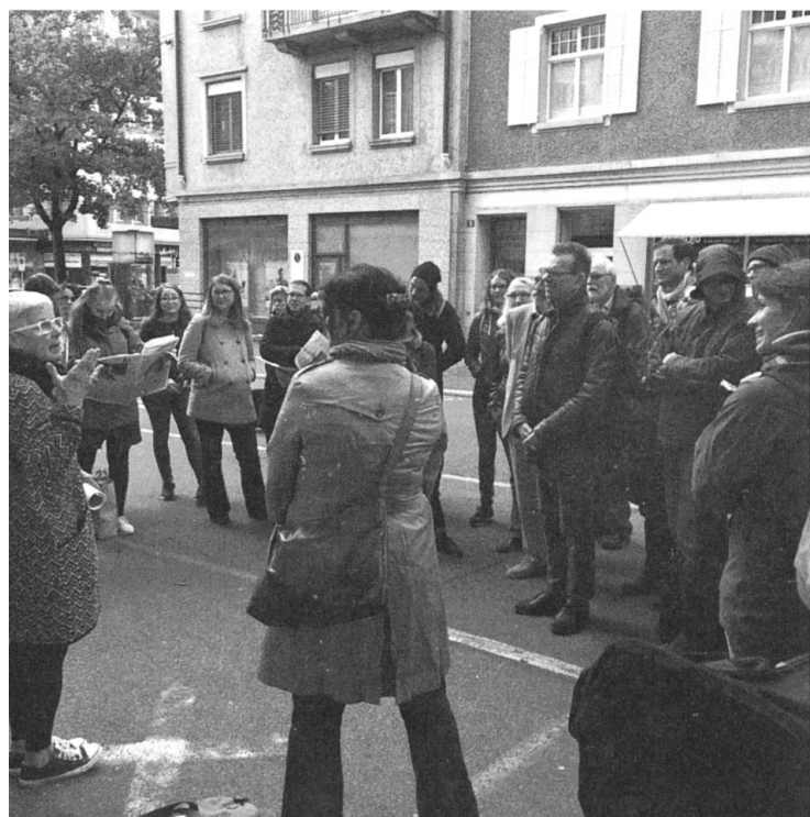
An der Apollostrasse

An diesem «modernen» Standort am Zeltweg verblieb das Volkskundliche Seminar aber nur wenige Jahre, bereits 1973 stand der nächste Umzug an – an die Apollostrasse 2, wo eine 5-Zimmer-Wohnung das neue Domizil wurde. Nötig wurde dieser Umzug, weil das Slavische Seminar am Zeltweg mehr Platz beanspruchte – die «Raumnot» bleibt bis zum heutigen Tag ein Thema. 16 Doch die immer weitere Zumietung von Einzelgebäuden bewirkte auch nicht-intendierte Nebenefekte, wie in der Universitätsgeschichte aus dem Jahr 1983 festgehalten wurde: «Allerdings zeichnete sich die Gefahr einer räumlichen Verzettelung und unnatürlichen Verselbständigung von Instituten, Seminarien und Teilen von ihnen mit unerwünschten betrieblichen