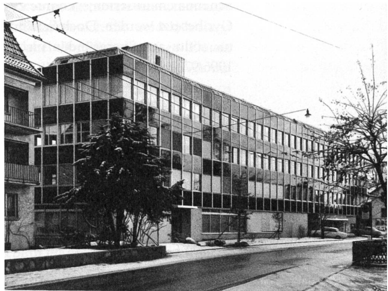
Der Zeltweg 1967, Fotografie aus dem Fotoalbum «Volkskunde Seminar», welches Ausschnitte aus dem Seminarleben der 1960er und 1970er Jahre dokumentiert.

Wie schon früher, war die Volkskunde auch 1978 nicht die Auslöserin der Umzugsaktion. Diesmal war es die Zentrale für Wirtschaftsdokumentation, die mehr Platzbedarf angemeldet hatte, und diesen auch bekam. Die häufigen, nicht aus eigenen Bedürfnissen heraus vollzogenen Raumrochaden zeichnen das Bild einer im Universitätsbetrieb nach wie vor eher peripheren Wissenschaft. Doch das Verbleiben an ein und